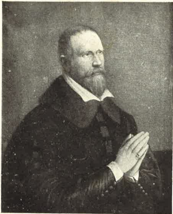
S. Girolamo Miani

Dipinto di Jacopo da Ponte detto il Bassano (1510-92) Museo Correr, Venezia.