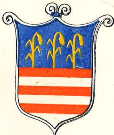
Stemmi della Famiglia di San Girolamo Emiliani, rinvenuti nella Biblioteca di Treviso