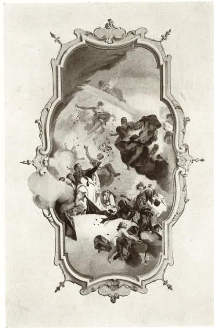
La pioggia d'oro, ossia Giove benefica le quattro parti del mondo

Corbetta possiede inoltre bei palazzi fra cui ricordiamo il Castello Frisiani, il palazzo Manzoli e Pisani Dossi e il no-