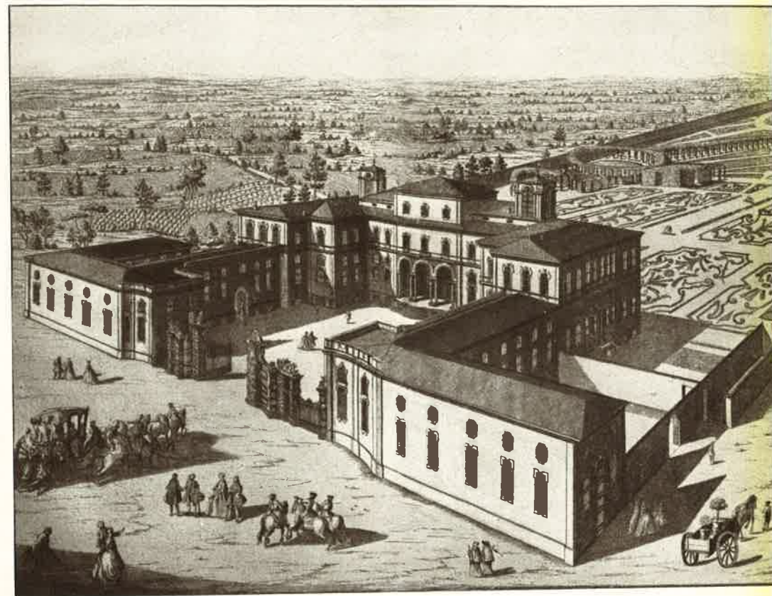
Veduta generale della Villa di Corbetta

Il P. Turco, eletto Provinciale nel Capitolo celebratosi in Roma nel 1923, appena poté e le mutate condizioni del nostro collegio di Nervi consentirono, raccolse intorno a sé un piccolo numero di aspiranti che poi nel 1925 diedero origine a quello che è il più imponente dei nostri Probandati quello di Cherasco, che merita un accenno speciale per l'organizzazione e il metodo educativo per cui il postulante anche nella sua istruzione è formato esclusivamente dai nostri.