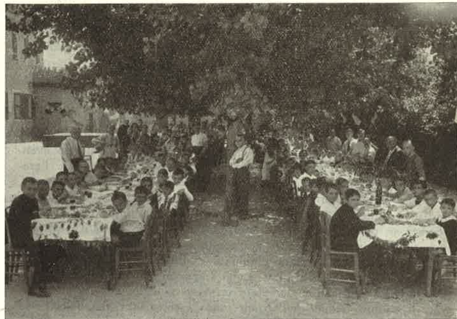
Treviso - Orfanotrofo Emiliani L'Agape dei bambini poveri della città