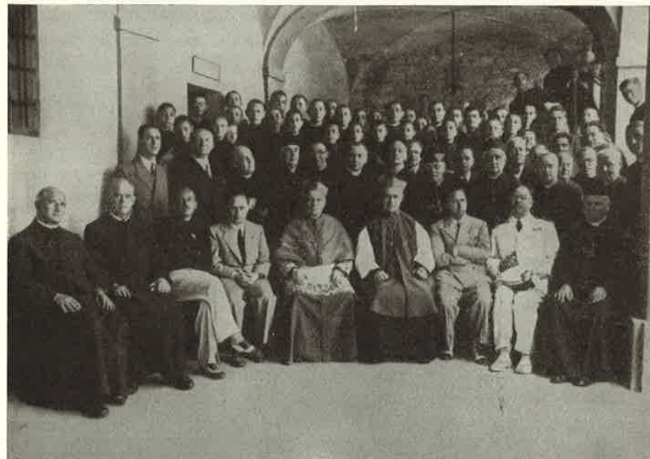
Pescia - LL. EE. i Vescovi di Pescia e Spoleto in mezzo alle Autorità, ai Padri e Postulanti Somaschi dopo la celebrazione centenaria di S. Girolamo