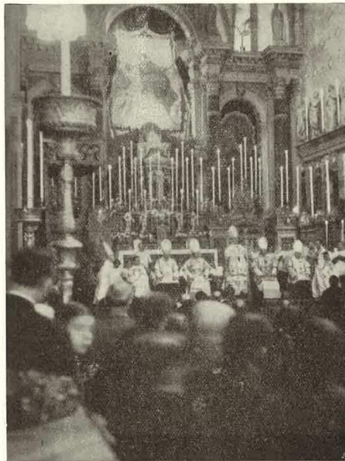
Venezia - S. Ecc. il Patriarca fa il panegirico di S. Girolamo nella Chiesa di S. Stefano nelle celebrazioni centenarie - 18 giugno 1937