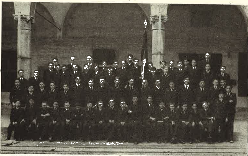
Associazione di A. C. "S. Girolamo Emiliani", del Collegio Trevisio - Casale Monf.

Sarebbe desiderabile che i gruppi imitassero le interne specialmente quanto riguarda la biblioteca; non c'è, infatti, Associazione che non l'abbia e organizzatissima e fornita di tutti i libri dell'A. V. E. Naturalmente la S. Girolamo Emiliani è in primo piano anche in questo campo.