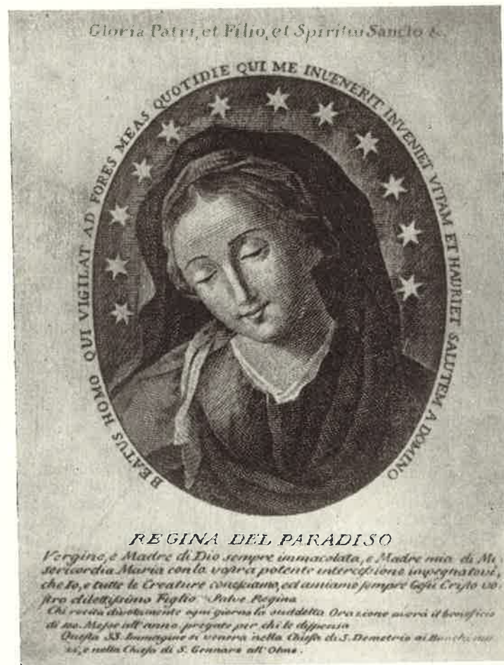
Napoli: S. Demetrio - Regina Paradisi

Fino a due anni or sono era tenuta in venerazione nella chiesa, già dei PP. Somaschi, di S. Demetrio in Napoli una immagine di Maria SS. ma sotto il titolo di "Regina Paradisi". Ci