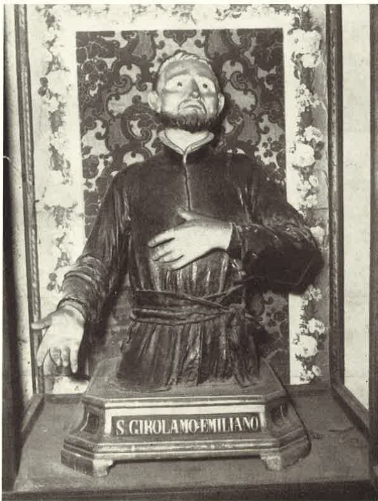
Ignoto: busto di S. Girolamo Em. in venerazione nella chiesa di S. Demetrio di Napoli, già dei PP. Somaschi