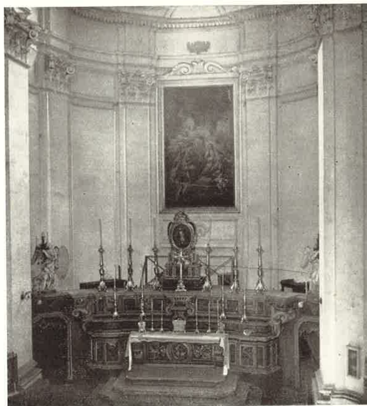
S. Demetrio di Napoli - Altare con il quadretto della Madonna Regina Paradisi

REGINA DEL PARADISO — Vergine e Madre di Dio sempre Immacolata, e Madre mia di misericordia Maria con la vostra potente intercessione impegnatevi, che io, e tutte le creature conosciamo, ed amiamo sempre Gesù Cristo vostro diletto Figlio.