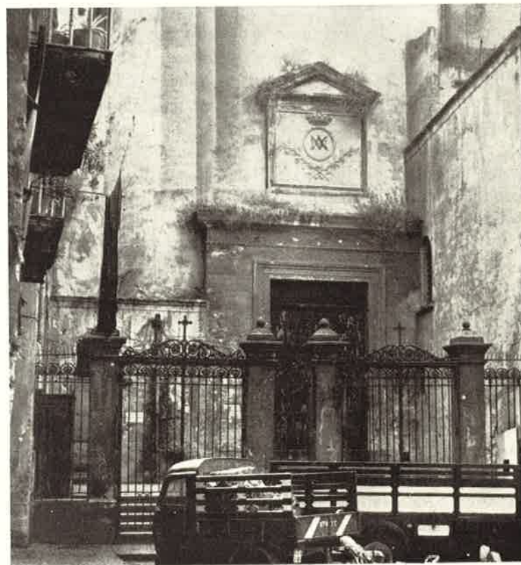
Facciata della chiesa di S. Demetrio ai Banchi nuovi di Napoli