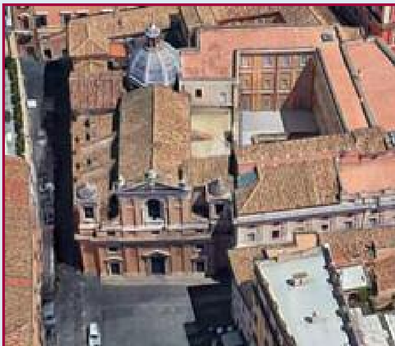
Complesso di Santa Maria in Aquiro: chiesa con a fianco l'orfanotrofio.

La stessa sera della vestizione partiva per Bassano dove era stato destinato dall'obbedienza.