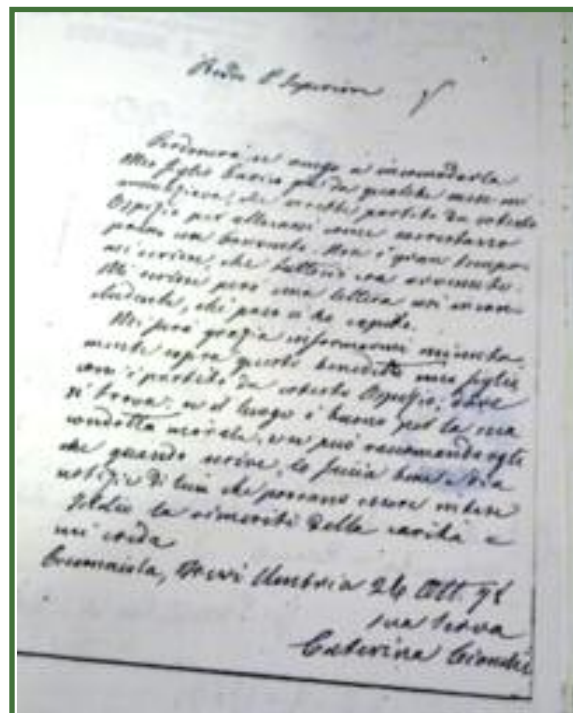
Sopra: Lettera della mamma di Righetto al rettore dell'Ospizio Tata Giovanni di Roma, mons. Gioacchino Persiani.

Monsignor Persiani rispondeva alla madre del giovane Righetto assicurandola che egli si trovava in un luogo sicuro moralmente e religiosamente.