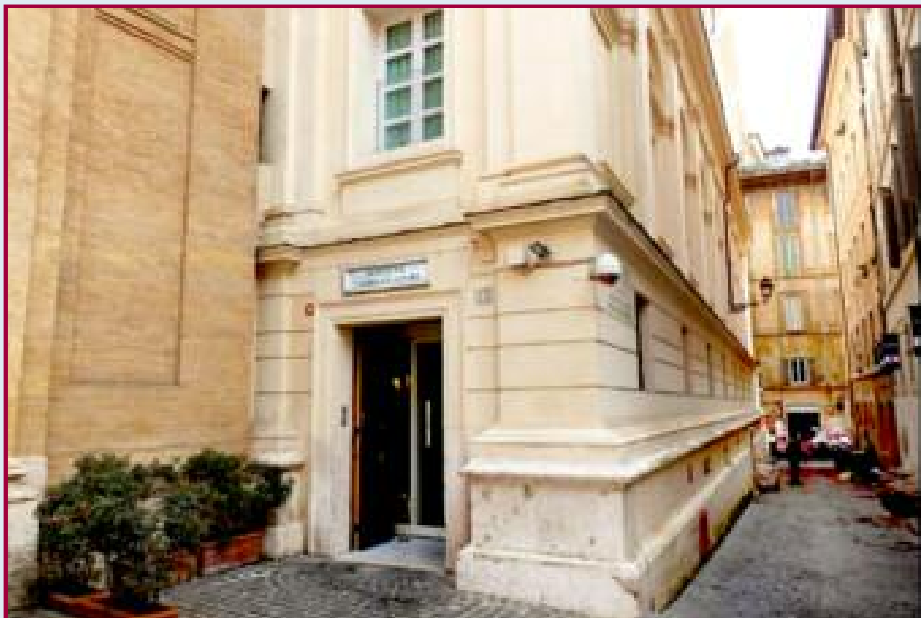
Ingresso dell'Istituto I.S.M.A., orfanotrofio al tempo di Righetto.

A Pag. 6: Santa Maria in Aquiro, altare di San Girolamo; davanti a questo altare Fratel Righetto vesti l'abito somasco il 28 novembre 1880.