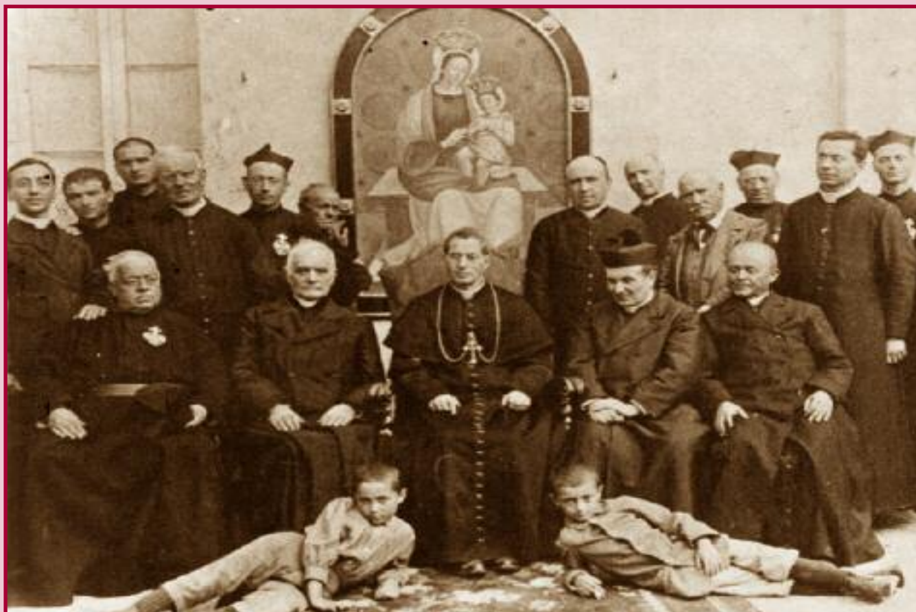
Santuario della Madonna della Stella. Foto ricordo del Processo Diocesano del luglio 1914, circa la veridicità delle apparizioni della Madonna al piccolo Federico Cionchi. Al centro il somasco Mons. Pietro Pacifici crs, Arcivescovo di Spoleto dal 1912 al 1934.