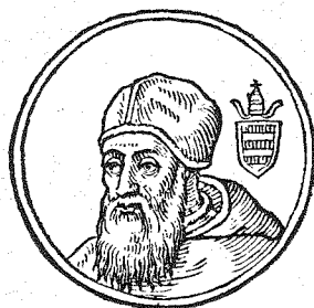
Il ritratto di Gian Pietro Caraffa, poi Sommo Pontefice col nome di Paolo IV, l'abbiamo preso dal Panvinio - Delle Vite dei Pontefici in continuazione a quelle del Platina stampata a Venezia presso Alessandro Vecchi MDCXII.