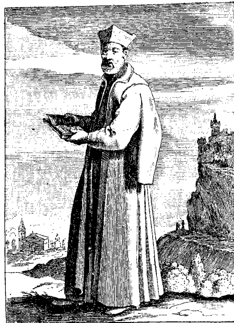
P. FEDERICVS PANICAROLA MEDIOLANENSIS. Congreg. Somascha Sacerdos.

Federico Panigarola, milanese, protonotario apostolico, fattosi compagno del beato Girolamo, lasciò onori e dignità per darsi tutto al servizio di Dio. Seguendo le orme del maestro, visse molti anni esemplare d'ogni virtù nell'orfanotrofio di S. Martino in Milano, sinchè, mosso da spirito divino, si ridusse a Somasca nel cui eremo finì la vita spesa in opere di carità e con opinione di santo. (Dal Breviario storico di religiosi illustri della Congregazione di Somasca).