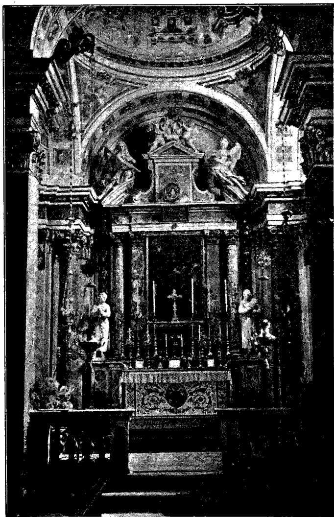
Altare della Cappella di S. Girolamo Miani nella Chiesa Parrocchiale di Somasca dove riposano le venerate Ossa del Santo e dove i bambini della prima Comunione di Somasca dopo di avere ricevuto il Pane degli Angeli hanno a lungo pregato per il Sommo Pontefice regnante (S. S. Pio XI)

Nessuno acquieti la propria coscienza col solo presenziare alle Sacre funzioni, ma tutti si facciano un dovere d'onorare S. Girolamo col presentarsi al Sacramento della S. Confessione e nutrendosi di quel Cibo soprasostanziale che è pegno sicuro d'immortalità beata.