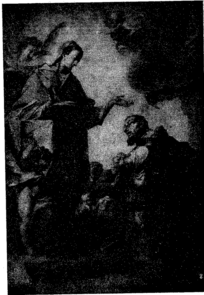
Quadro esistente nel Collegio Gallio di Como, di autore ignoto.

L'arte nelle sue varie espressioni volle anch'essa tributargli il suo omaggio nel corso dei secoli e narrò la vita di lui, le sue gesta, i suoi trionfi in accurate agiografie, e ne eternò la memoria nei ritmi della poesia, nei colori della pittura e nella plasticità delle forme scultorie, sforzandosi di ritrarne le sembianze o particolari episodi di quella mirabil vita che, spesa più per altri che per sé stesso, fu davvero meritevole di entusiastici consensi e della finale apoteosi.