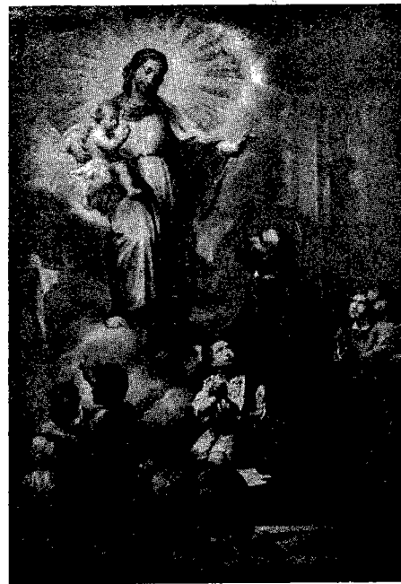
Tela di Pietro Gagliardi (Collegio Rosi - Spello)

Di esse gran parte sono di autore ignoto, quantunque talune pregevoli se non altro per la loro antichità, come il quadro raffigurante la Vergine che libera l'Emiliani, di-