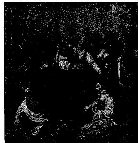
Quadro di Daniele Crespi detto il Cerano.