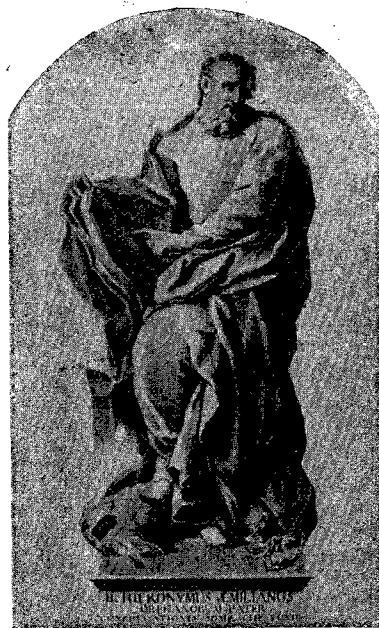
Statua del Bracci (S. Pietro in Vaticano - Roma).

bilmente non venne eseguito affatto perchè la sua umiltà così volle: e solo ci è rimasta la sua nobile e maestosa figura a mezzo busto in abito da senatore, dipinto da Jacopo da Ponte, detto il Bassano (1510-1592) ed ora esistente nel museo Correr di Venezia. Il Pittore alla morte del Santo avrebbe avuto 27 anni e si discute se lo abbia o no conosciuto di persona, perchè l'Emiliani in quell'ultimo periodo della vita si trovò quasi sempre in Lombardia e il pittore sembra che non si movesse da Venezia; ma più indubbiamente avrà conosciuto la famiglia del Santo, e questa o altri ammiratori o amici nel commettergli di effigiare le sue sembianze, avranno certamente concorso con le loro indicazioni a far sì che esse riuscissero per lo meno le più verosimili; ed ecco perchè io riterrei che il noto ritratto del Da Ponte è fino ad oggi e fino a prova contraria il più probabile, se non il più autentico e rassomigliante ritratto di S. Girolamo Emiliani.