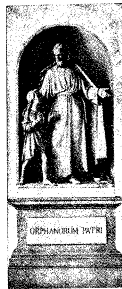
Statua di Giov. Ant. Labus (Milano)

nella pietra, offrendoci opere che se non assurgono all'altezza d'insigni monumenti e di capolavori dell'arte, tuttavia sono in parte pregevoli per la correttezza dello stile o per la religiosa indovinata ispirazione. Una statua dell'Emiliani scolpita dal fiammingo Giambattista Morlaiter troneggia sull'altare maggiore della chiesa della Salute in Venezia; un'altra sopra una delle guglie del duomo di Milano; ma lo scrivente confessa di non averle presenti alla memoria e d'ignorare l'espressione e l'autore.