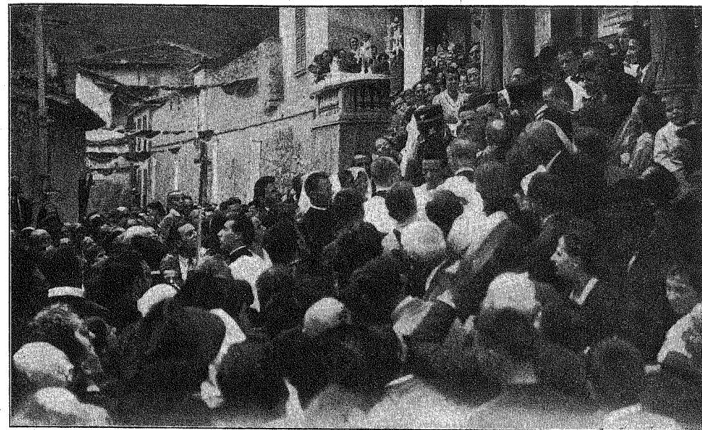
Il Cardinale lascia Somasca acclamato da immensa folla esultante.

teriali, innanzi a queste orme, bisogna controllare i nostri concetti. Oggi abbiamo udito la voce del Signore che ha parlato per mez-