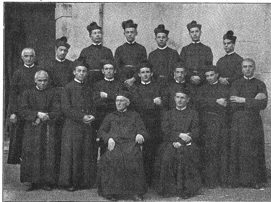
NOVIZIATO DI SOMASCA, 28 Settembre e 14 Ottobre 1932 - VESTIZIONE RELIGIOSA.

Oh se tutti conoscessero il tesoro nascosto di cui si gode nella vita religiosa! Essa non è che un preludio di quella celeste vita di cui godremo in cielo quando vedremo Dio sicuti est . Il nostro augurio è che molti entrino, spinti dallo Spirito di Dio, nelle file dell'Emiliani, e che ricevano da noi come i novelli confratelli quell'abbraccio di