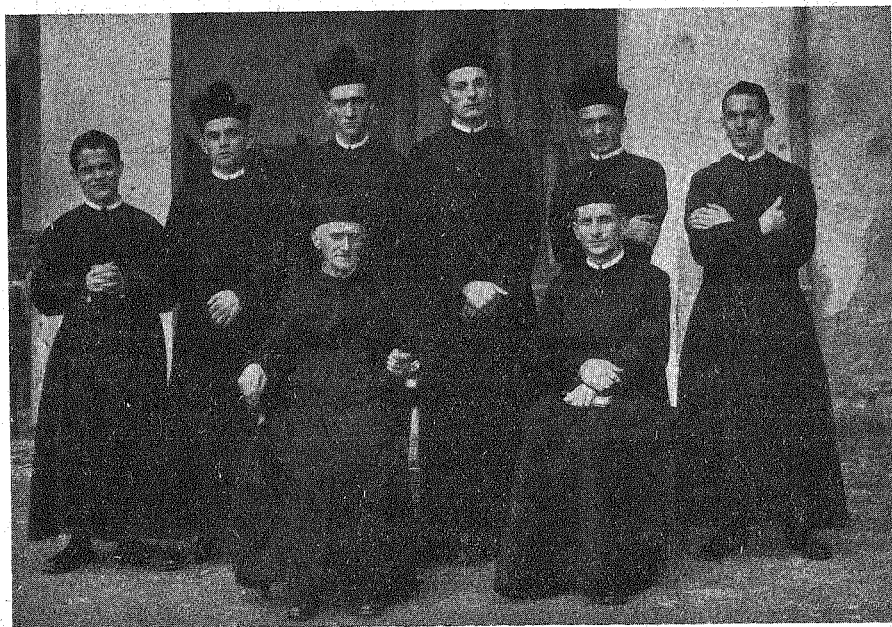
IL NOVIZIATO DI SOMASCA, 28 Settembre 1932 - PROFESSIONE SEMPLICE.

Povertà, Castità, Obbedienza , ecco i tre chiodi con i quali si sono inchiodati alla croce di Gesù. Quale differenza tra le vittime del mondo e quelle di Cristo! Queste sono coronate di spine e sono inchiodate