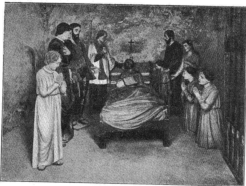
SOMASCA - SANTUARIO DI S. GIROLAMO (Una delle Cappelle) - LA MORTE DEL SANTO - 8 Febbraio 1537.

Su dal colle di S. Genesio si irradia una luce diffusa che diviene ognor più intensa, finchè appare tondo e rosseggiante il disco lunare. Tutto allora muta aspetto: il lago diviene d'argento: nell'ombra della notte i casolari occhieggiano nitidi e distinti, ci pare di non essere più soli. Avviciniamoci là a quel casolare poco lontano da Merone. Il