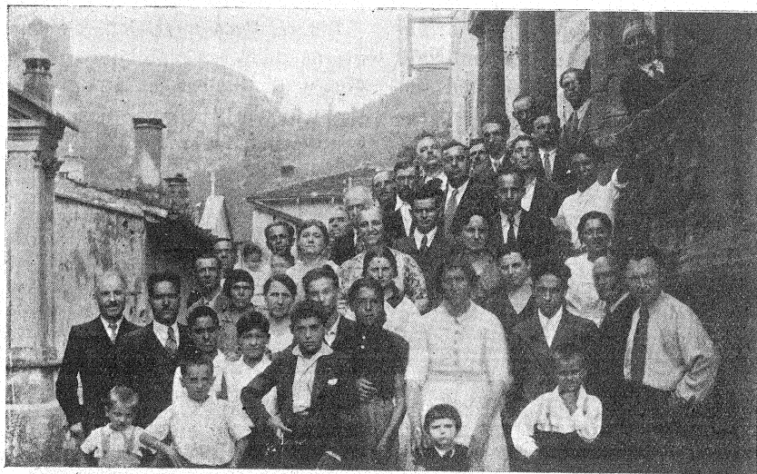
Ex Orfani della «Colombina» colle loro famiglie - Pellegrinaggio del 25 agosto 1935.

sue Sacre Ossa, Voi, che foste e siete sempre i suoi prediletti.