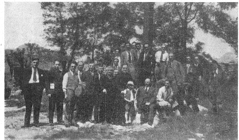
Unione Uomini Cattolici dell' «Immacolata» di Milano - Pellegrinaggio del Luglio 1935.

L'Egr. Presidente della Società degli ex-orfani della « Colombina » ho voluto degnarsi di inviare al R.mo Superiore del Collegio dei Padri Somaschi, la seguente gentilissima lettera: