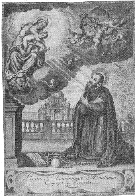
Beatus Hieronymus Emilianus Congregatus Somaschi Fundator