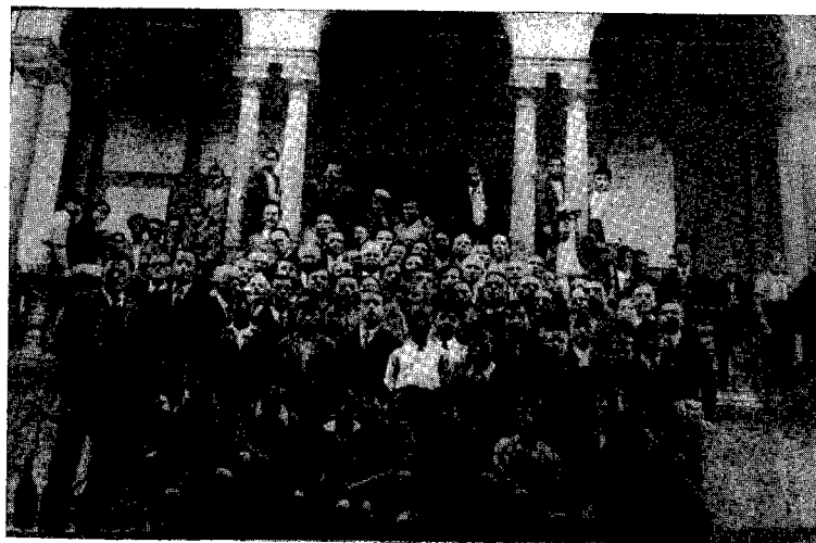
CREMA Pellegrinaggio di Giovani Cattolici