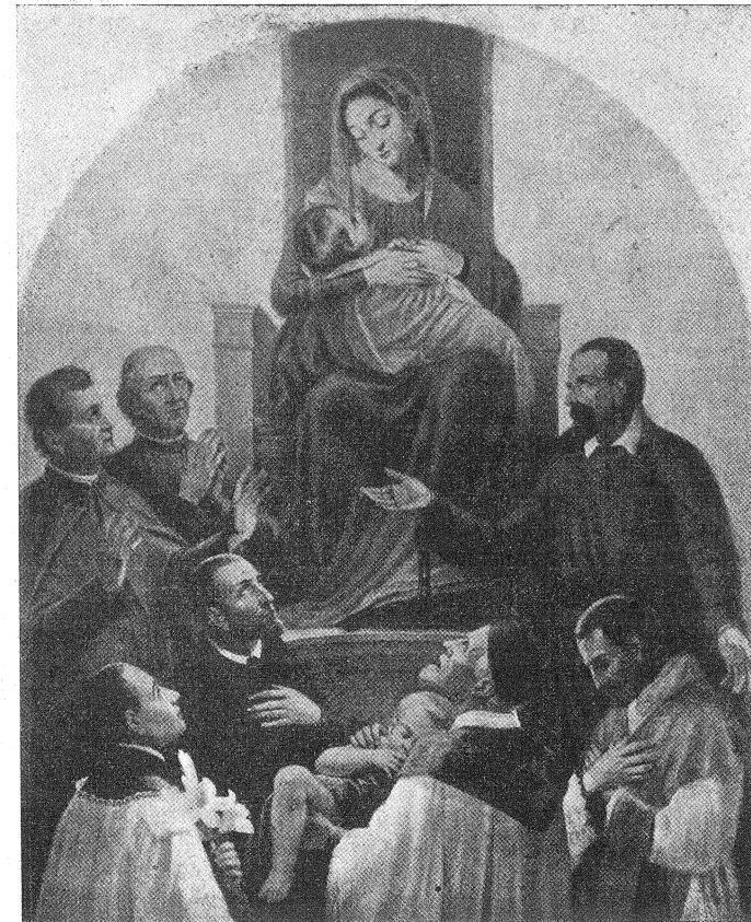
(G. B. CONTI)

mento che l'Ordine Somasco ora sente correre per le sue vene, fa sperare bene per l'avvenire. A questo scopo sono necessarie molte preghiere. Perciò fu istituita «La Crociata S. Girolamo Emiliani». Ascri-