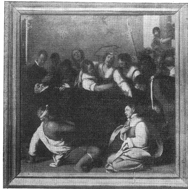
LA MORTE DI S. GIROLAMO EMILIANI

D. Crespi (1590? - 1630) detto il Cerano