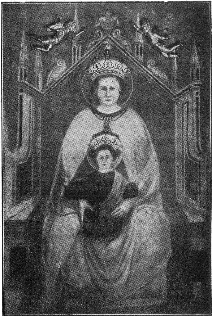
TREVISO - MARIA SS.ma MADRE DEGLI ORFANI (LIBERATRICE DI S. GIROLAMO DAL CARCERE)

Notte di grazia e di prodigio un mese languiva nel Castello di quella tra il 26 ed il 27 settembre Quero, fiducioso attendeva l'aiuto 1511. Il valoroso capitano che da della Madre degli Orfani e derelitti.