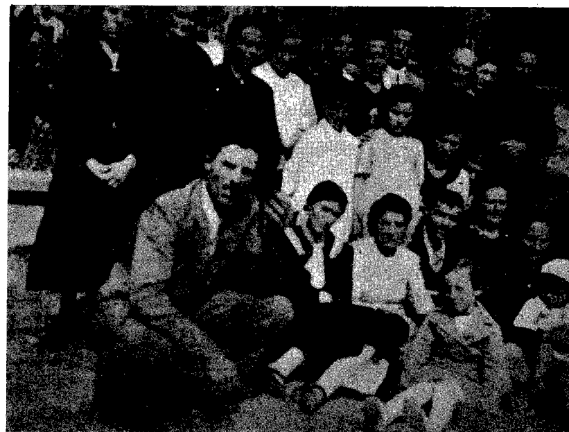
PELEGRINAGGIO DI OSNAGO