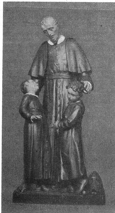
S. GIROLAMO MIANI