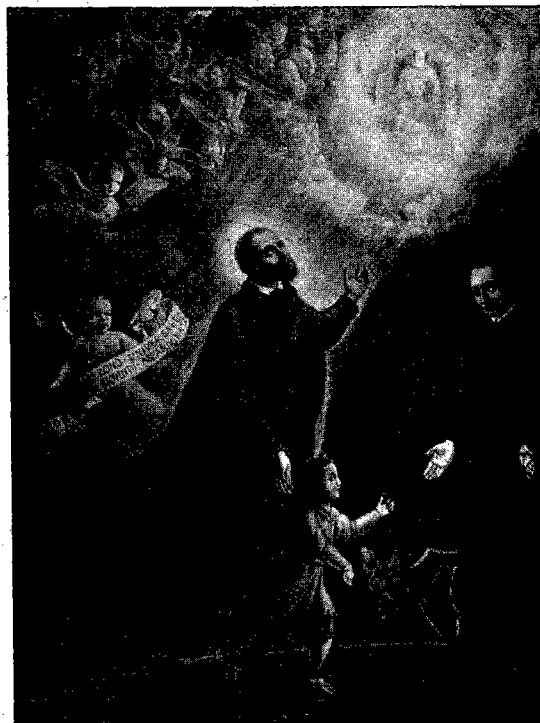
S. GIROLAMO per primo affida la missione di assistenza dell'orfano e della gioventù abbandonata all'Ordine religioso dei Padri Somaschi da lui istituito.

(Somasca, particolare dell'affresco del pittore C. Cocquio).