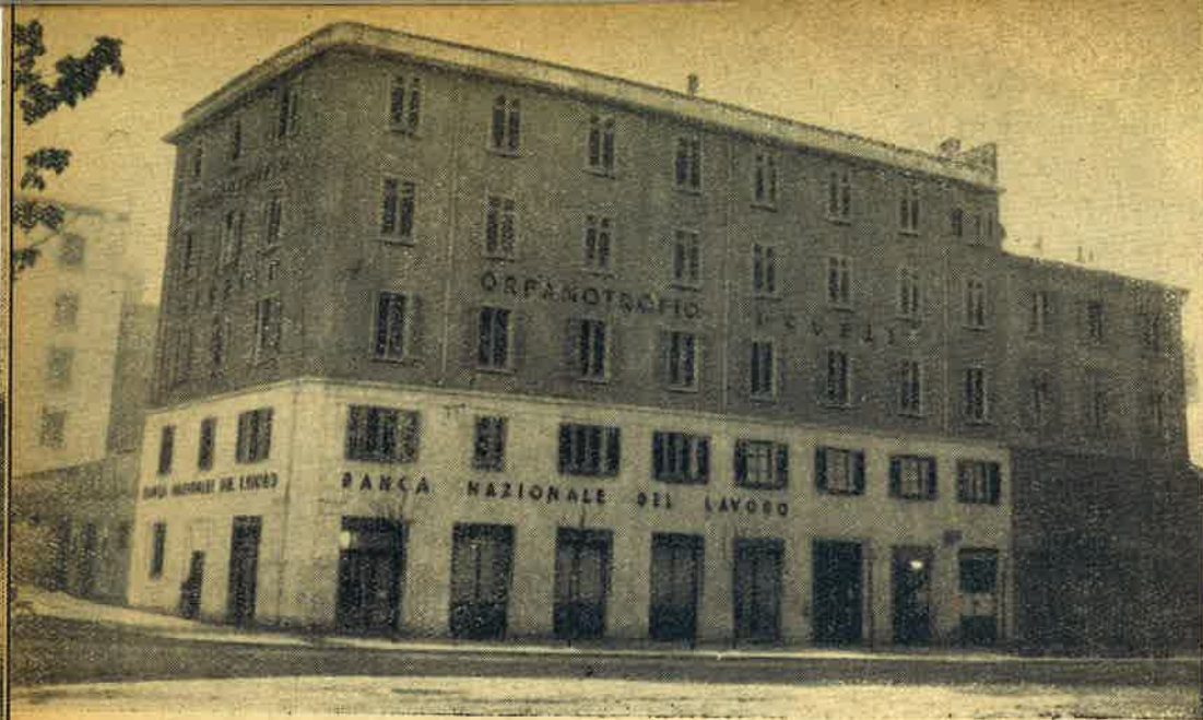
L'esterno dell'Orfanotrofio che sorge in Corso Garibaldi n. 118