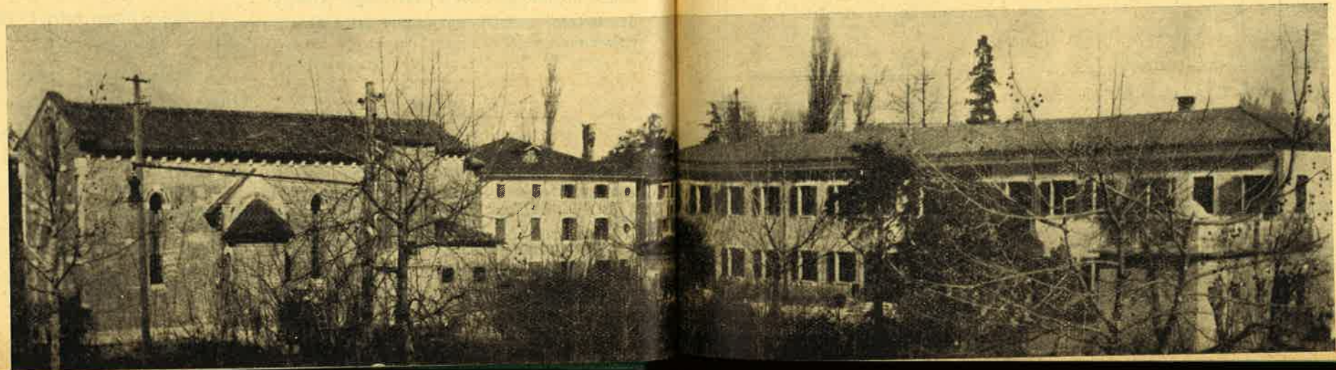
Il complesso degli edifici dell'orfanotrofio prima della distruzione