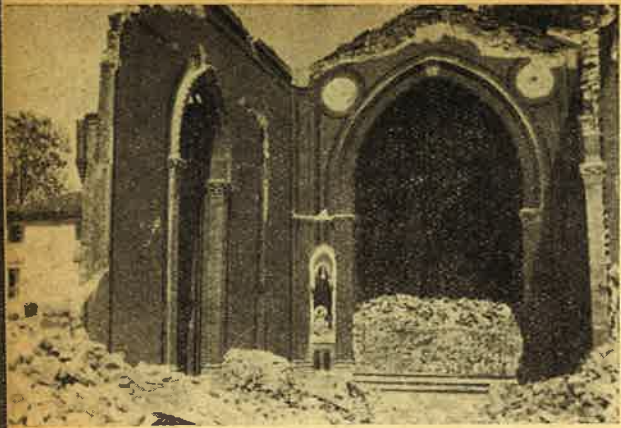
La Chiesetta dopo la distruzione