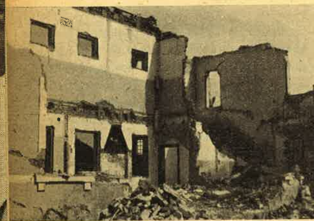
L'edificio centrale distrutto dai bombardamenti