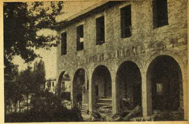
L'ala minore dell'orfanotrofio risorge....

e il padiglione centrale con tutti i servizi furono distrutti quasi completamente; gravemente lesionata l'ex villa Battistina; bruciato il resto. Nel 1945 con grandi sacrifici si sistemarono i locali e si ritorna dalla sede di sfollamento. Finalmente nel febbraio 1951 inizio dei lavori di ricostruzione! Per intanto si è cominciato con l'ala minore dell'edificio in progetto, con l'aiuto della Provvidenza si spera di arrivare fino al termine. Allora dovrebbe esserci il posto per oltre un centinaio di orfanelli. L'Orfanotrofio comprenderà ben tre sezioni: 1) il nido per i piccolissimi (dai 4 agli 8 anni); 2) le scuole elementari e professionali; 3) l'apprendistato. Lo spirito di sacrificio dei Padri preposti e la larga simpatia della popolazione di Treviso per l'Orfanotrofio, sono auspicio di buona riuscita.