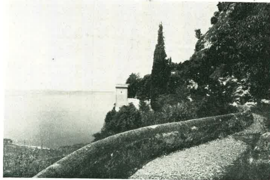
Somasca, angolo di pace

Non già a Somasca la folla che stordisce, ma il pellegrino che prega e vive quelle inusitate dolcezze: non la moltitudine travolgente e festaiola, ma il fedele che spera e crede e la sua speranza e la sua fede le traduce in atti di venerazione al Santo della Carità, in adorazione al Datore di ogni bene Il Santo della vita umile e penitente vuole ancora rimanere tale nel dispensare dal Cielo le sue