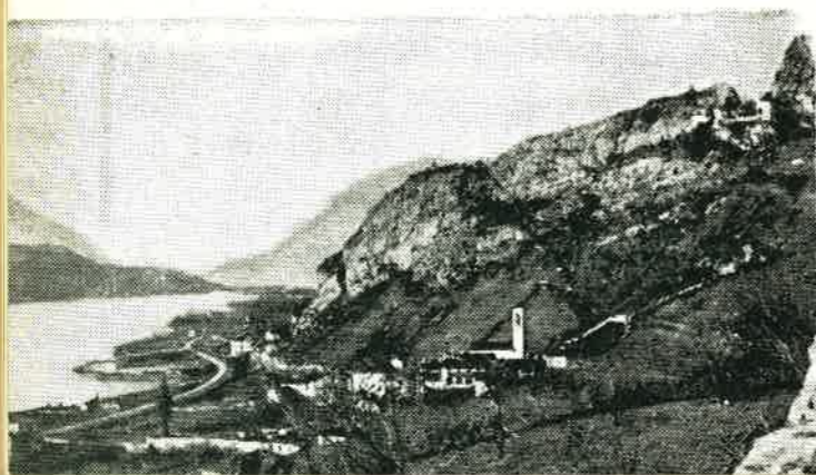
Somasca vista da Garlate.