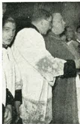
Mons. Vescovo ammirando gli altari

S. Girolamo benedica il vostro lavoro, molto simile a quello che la Madonna esercitava verso Gesù e nel ritiro mensile vi infiammi con l'esempio eroico delle sue virtù sì da diventare sempre più e meglio vere « Crociatine Somasche ».