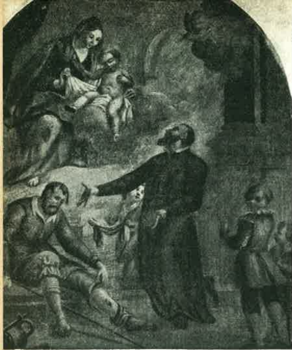
S. Girolamo e gli infermi