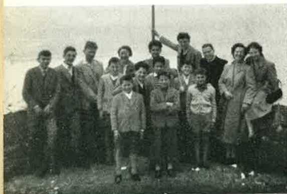
Gruppo di amici di Cherasco

« Non siamo milionarie, quindi il nostro contributo non è in moneta, ma in un lavoro conveniente alla nostra condizione di donne. Ogni mercoledì si dedica la serata, e non solo in questo periodo invernale, ma in tutto l'anno, al rammendo della biancheria dei ragazzi e più ancora della Chiesa. I ragazzi sono numerosi e i loro indumenti si logorano tanto presto!... Per noi è sempre stato un lavoro gioioso. Tra la