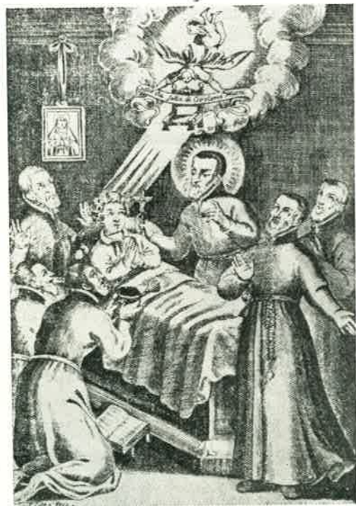
La visione dell'orfanello

Dalle parole del Santo emerge la figura e la missione degli Amici e Benefattori, da un solo ideale infiammati: Salvare la gioventù abbandonata!