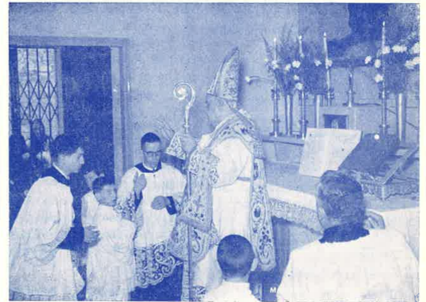
*Consacrazione altare compiuta a Somasca il 26 Settembre 1953.