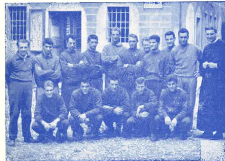
← E la squadra di calcio del Novara con l'allenatore, venuti a chiedere la protezione di S. Girolamo per iniziare con successo il campionato. A loro i nostri auguri.

La famiglia Somasca si estende sempre più: Svizzera, El Salvador, Honduras, Mexico, Guatemala, Spagna, U.S.A. - Manchester ed ultimamente anche a Torino. Quale sarà il prossimo volo?