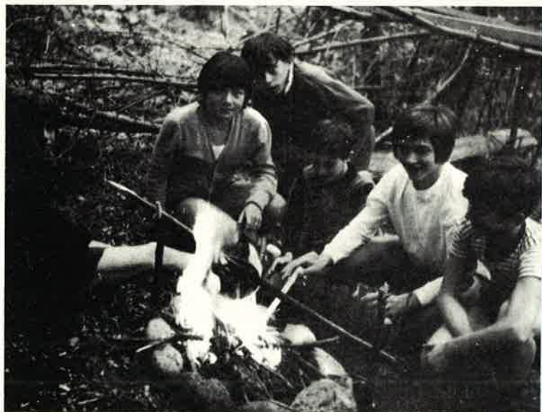
I Falchi, intenti a cuocere le castagne, nella loro capanna nel bosco.

cativo che si ispira allo scoutismo e si basa sulla ripartizione dei ragazzi in piccoli gruppi (squadriglie). Tale sistema agevola il frazionamento della massa, per raggiungere l'individuo in un colloquio educativo più diretto. Si invitano così i ragazzi alla responsabilità della propria formazione, al senso sociale e allo spirito di collaborazione: si noti che le squadriglie sono costituite da ele-