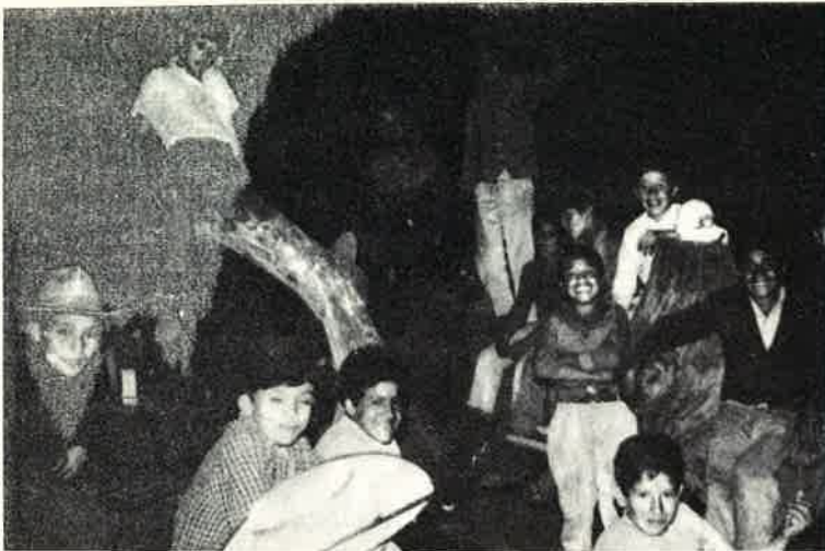
Seminaristi somaschi del seminario di Zetaquira.

Negli anni successivi dal 1968 al 70 arriva la seconda, la terza, la quarta «bachillerato»: in tutto 85 ragazzi. L'opera somasca di Zetaquira sembra così avviata bene, sotto gli auspici di S. Girolamo.