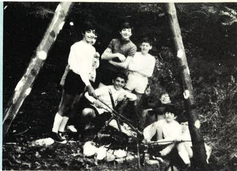
17-10-71 La squadriglia delle Gazzelle, attorno alle castagne arrosto.

menti eterogenei per età e classe scolastica, reclutati in base alla scelta personale. Attraverso gli incarichi e le attività di squadriglia si coltiva la spontaneità, si stimola lo spirito di iniziativa. A ciò molto contribuisce la buona formazione dei capisquadriglia, ragazzi seriamente impegnati nel servizio verso gli altri, a cui la Direzione partecipa parte dell'autorità che le compete, in un rapporto