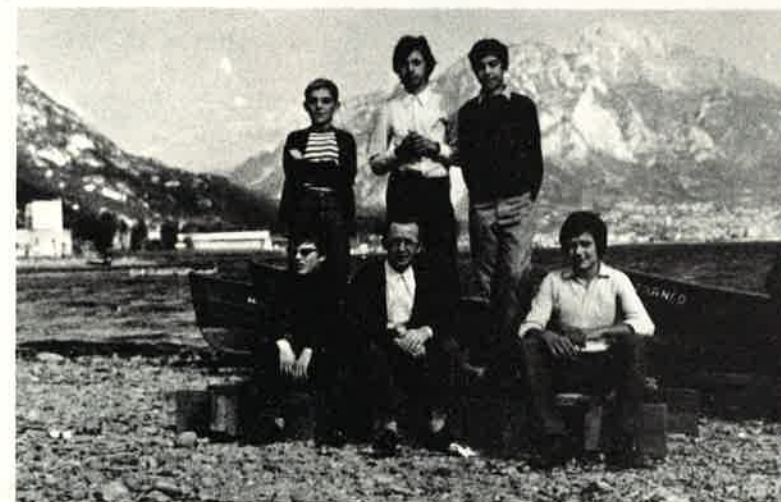
I caposquadriglia del gruppo «Emiliani» col loro capogruppo.