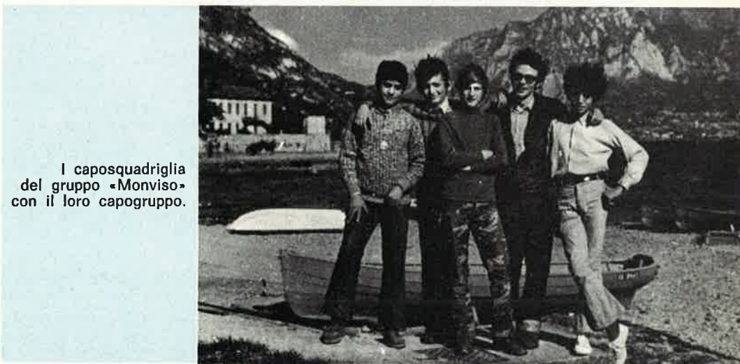
I caposquadriglia del gruppo «Monviso» con il loro capogruppo.