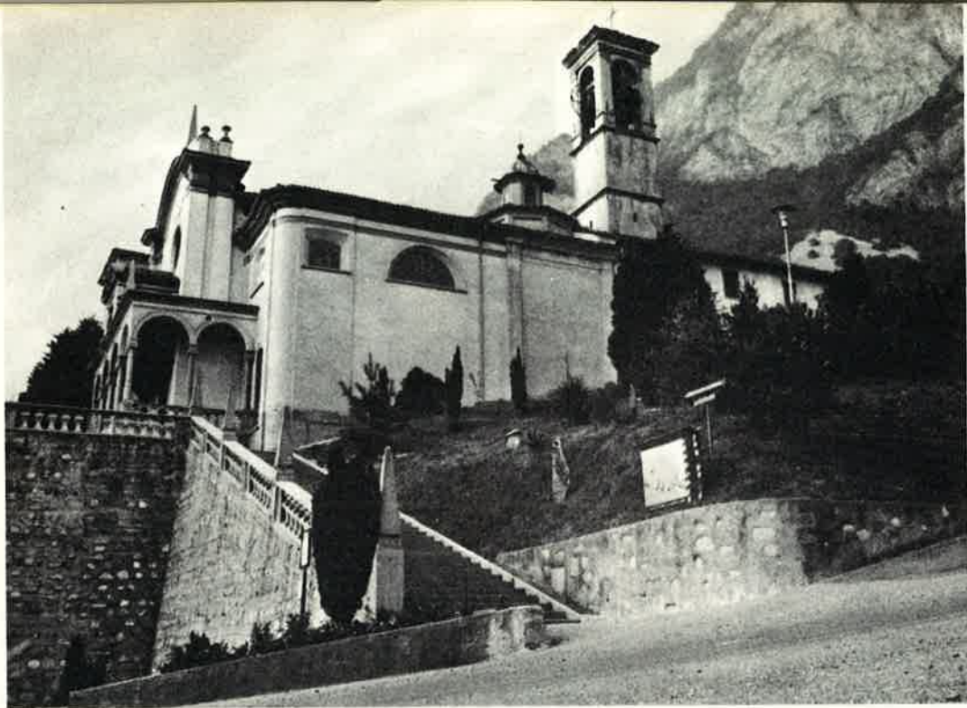
Santuario di S. Girolamo dove si venera il corpo del Santo.