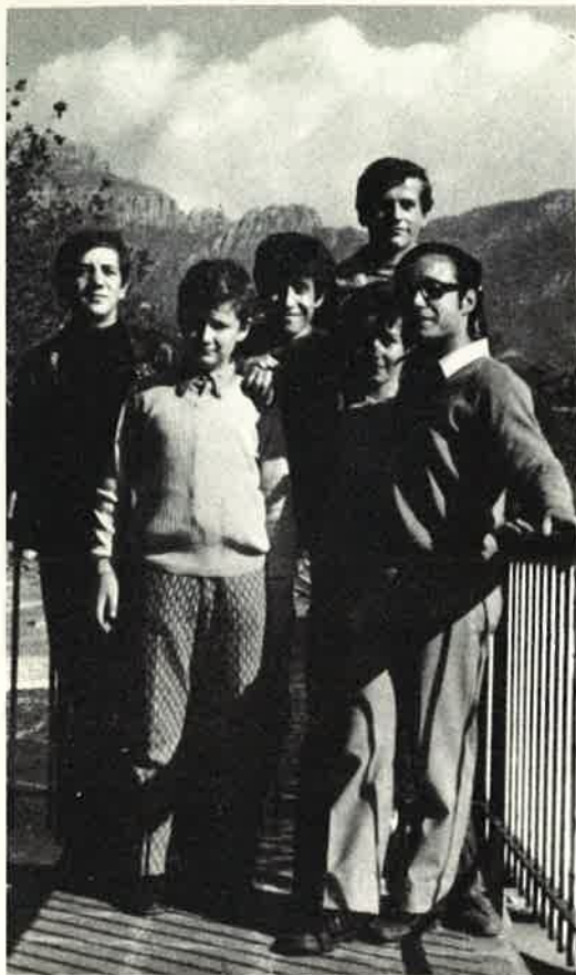
I caposquadriglia del Gruppo «Stella Alpina» col loro capogruppo.

no; espressioni che rivelano la serietà con cui questi ragazzi affrontano il loro compito e nello stesso tempo esprimono un sincero ringraziamento ai Padri e alla gente di Somasca per la loro calorosa accoglienza.