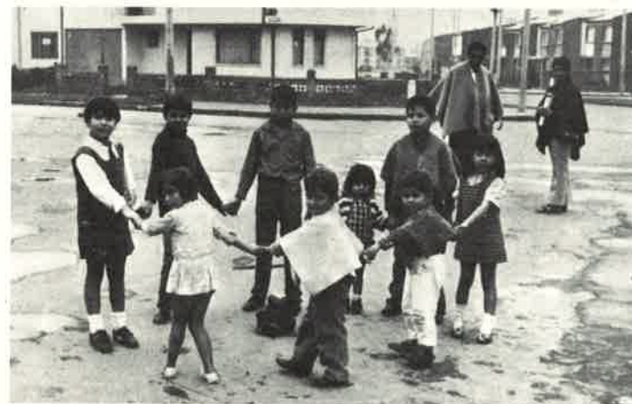
Bambini della parrocchia di Bogotà - N.S. di Guadalupe.

Per il febbraio del 1967 tutto è pronto e 35 giovinetti vengono a colmare il seminario de « los Padres Somaschos ». Devono frequentare la quinta elementare e la prima « bachillerato ». Sono quasi tutti piccoli di statura anche se avanti con gli anni: 15, 16, 19 anni! Sono però come tutti i ragazzi di questo mondo: una nota dominante nel loro carattere è la timidezza.