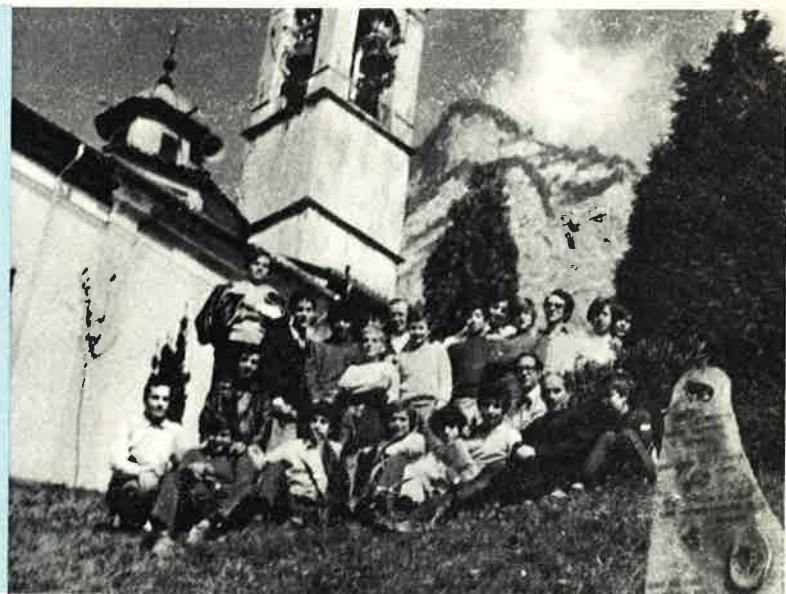
Educatori e caposquadriglia del Collegio di S. Mauro Torinese a Somasca.

Crediamo opportuno riferire alcune impressioni raccolte tra i partecipanti al radu-