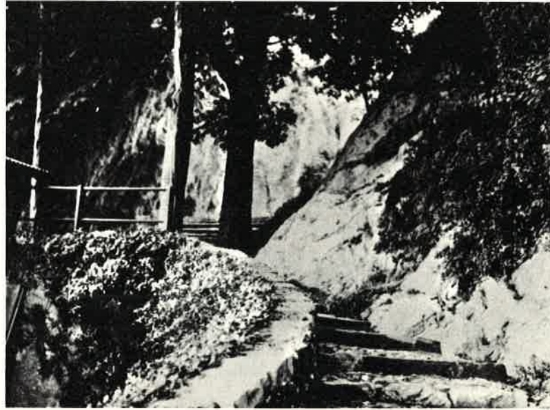
Panoramica della strada per la Valletta

Un gruppo di impiegati della metropolitana di Milano. Il capo dichiara: «Siamo in sciopero e ne approfittiamo per venire a trovare S. Girolamo!».