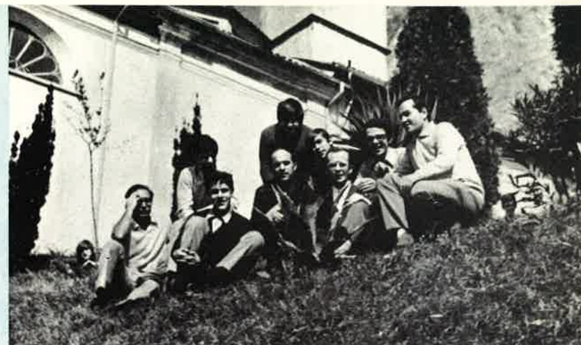
Il gruppo degli Educatori.