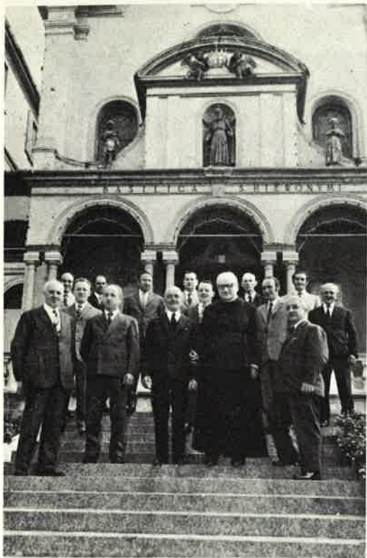
La Schola Cantorum di Cavenago con il suo Parroco, il direttore del coro e l'organista.