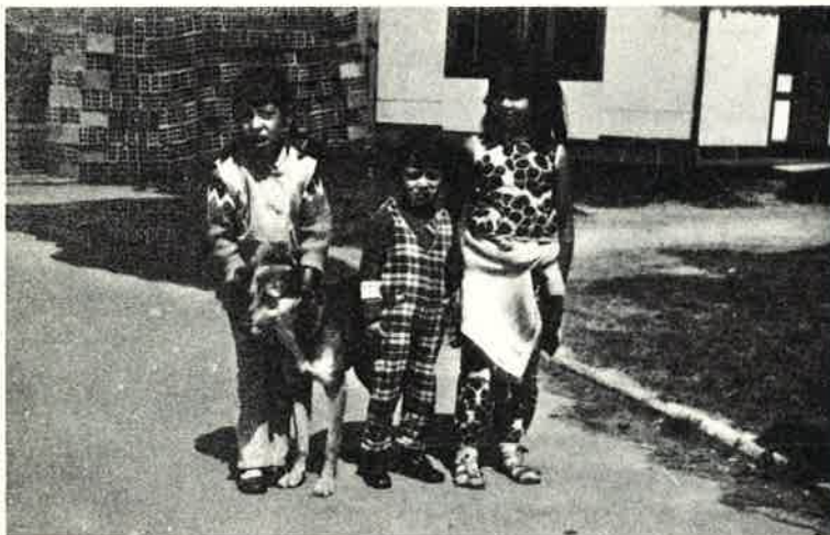
Bambini della parrocchia di Bogotà - N.S. di Guadalupe.