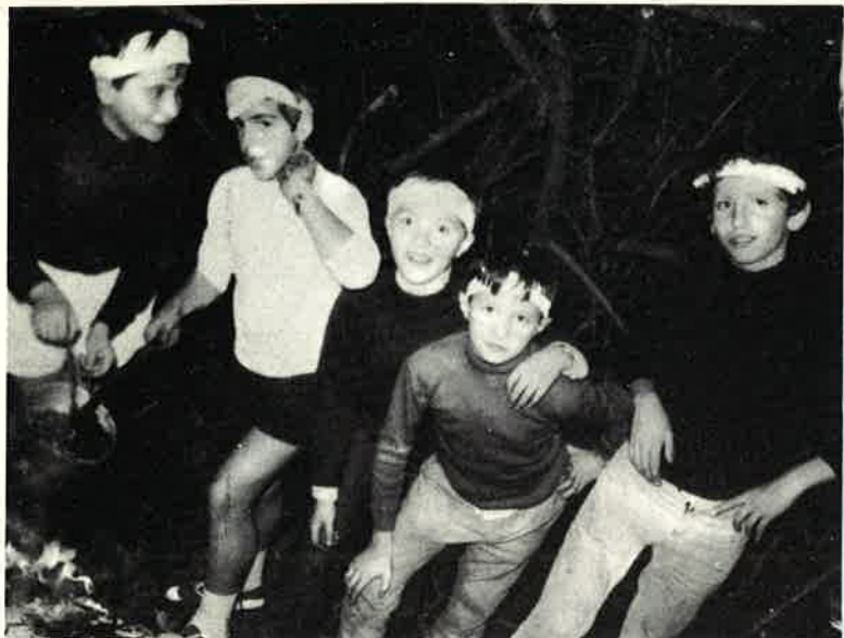
I Puma nella loro capanna nel bosco.

Volendo mirare più al fattore qualitativo che alla quantità, si è cercato di ridurre il numero dei collegiali ad un massimo di centoventi. Si tratta di ragazzi adolescenti con oscillazione di età tra gli undici e i quindici anni, corrispondenti scolasticamente alla quinta elementare e alle tre classi della Media Inferiore. Dopo il positivo collaudo in altri Istituti, è stato adottato il sistema edu-