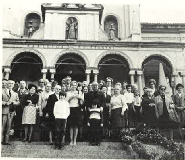
Da Milano: un gruppo di ragazzi dell'Istituto Uselli dei Padri Somaschi e una comitiva della parrocchia di S. Simpliciano.