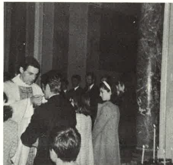
Il momento più bello dell'incontro: la Comunione Eucaristica