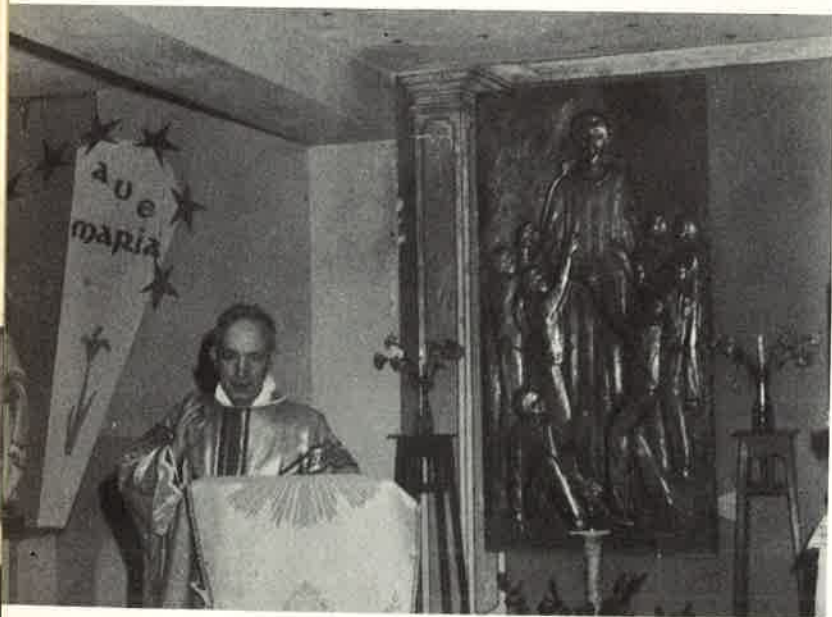
Il Delegato Vescovile ci parla del Santo.

Nella Chiesetta che sorgerà accanto all'Istituto, per le necessità spirituali del numeroso rione di Corosa, sarà onorato il nostro Santo.