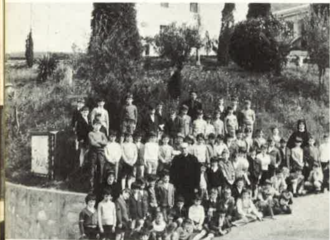
Bambini e bambine della 1.a Comunione della Parrocchia di Nembro con il loro Arciprete