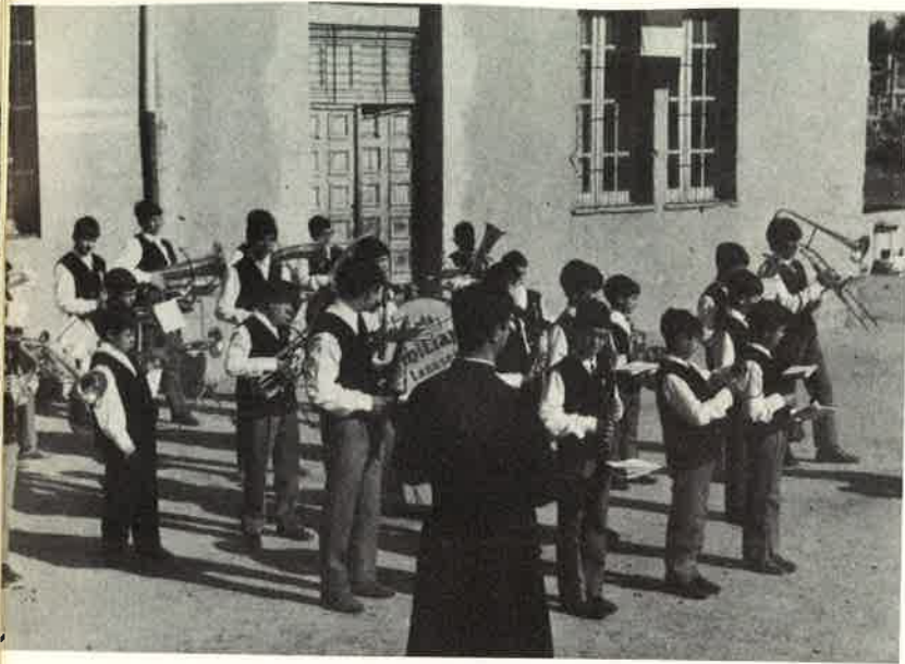
La Banda schierata in occasione dell'inizio dell'anno sociale.

S. Girolamo dal cielo benedirà questo Istituto, a lui consacrato, perché possa completarsi anche nelle sue strutture materiali, in questa zona della Sardegna tanto bella, ma ancora bisognosa di tante cose.