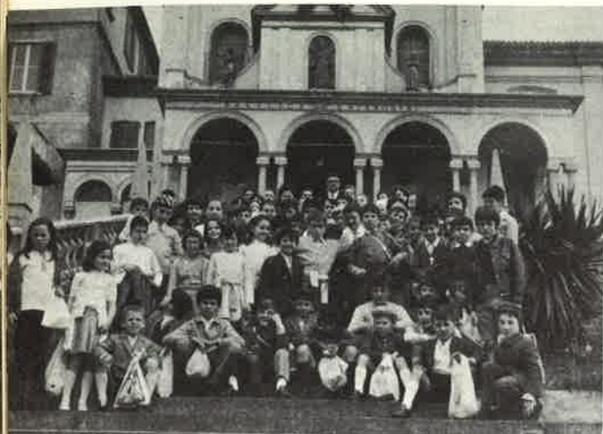
Alunni delle scuole elementari di Annico (Cremona) con i loro maestri