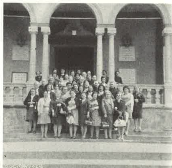
Un gruppo di donne della Parrocchia di Crea