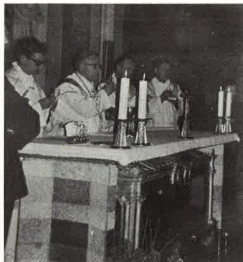
Da Cherasco (Cuneo) sono venuti in pellegrinaggio al Santuario i ragazzi del Collegio vocazionale S. Girolamo con i loro Superiori