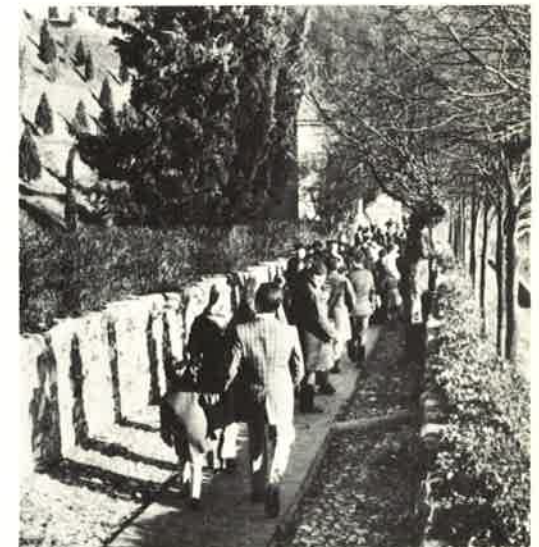
Si scende a Somasca