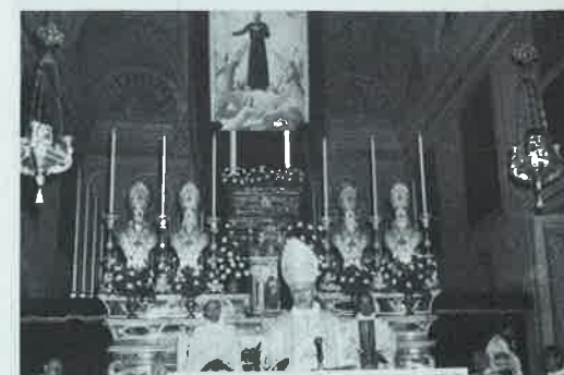
Omelia di S. Ecc. Mons. Arcivescovo