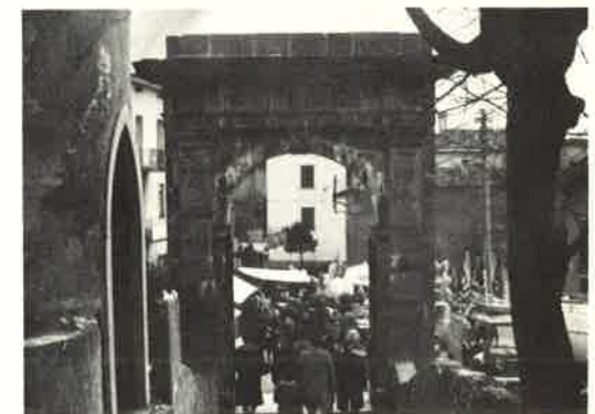
Tra le bancarelle