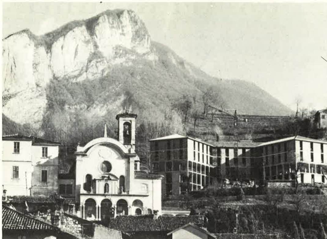
Il Santuario di S. Girolamo con la casa degli Esercizi Spirituali, Villa Miani che attende l'aiuto di tante persone buone per la sua completa realizzazione