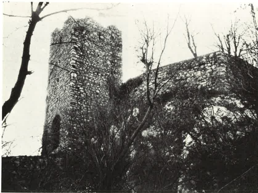
Il Castello dell'Innominato.

Il Manzoni fu alunno per vari anni dei Padri Somaschi a Merate prima e poi a Lugano, imparando tante cose sulla fede dai nostri Padri, tanto che alcuni non esitano ad accostare le conversioni che il Manzoni introduce nel suo romanzo (Padre Cristoforo e l'Innominato) a quella che egli dovette aver sentito nelle nostre case, che tendevano a glorificare la figura di convertito del nostro caro Santo.