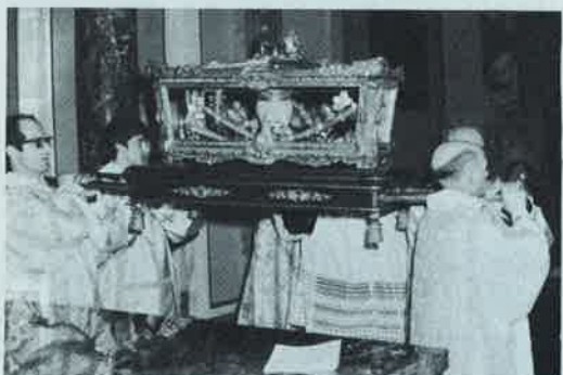
Inizio della Processione