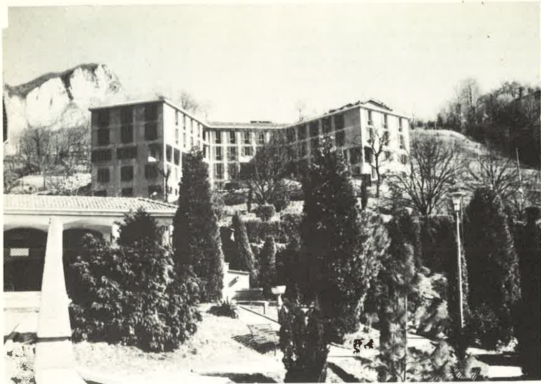
Il Santuario di S. Girolamo con il Centro di Spiritualità che attende l'aiuto di tante persone buone per la sua completa realizzazione