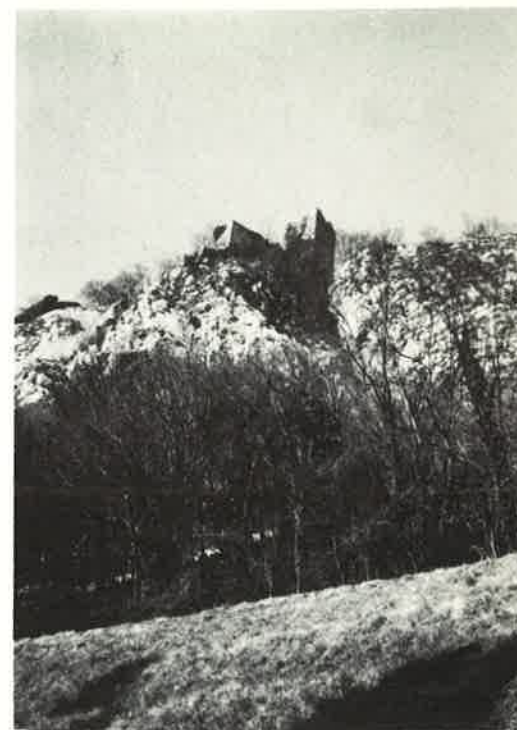
«L'Innominato, da un'alta finestra del suo castello, guardava verso uno sbocco della valle...». (Da i "Promessi Sposi").

Ma non vi è dubbio che il castello dello Innominato, anche se poi egli ne arricchisce con la sua fantasia l'ubicazione, sia da collocarsi proprio sul castello dove il Santo un secolo prima aveva stabilito la dimora sua e quella dei suoi compagni. Lo dimostra chiaramente il fatto della sua asserzione che il castello era posto proprio sul confine tra