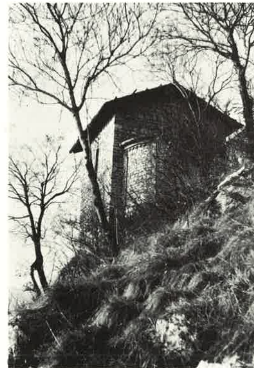
L'abside della Cappella di S. Ambrogio al Castello.

il Ducato di Milano e la Serenissima Repubblica di Venezia, come lo dimostra il fatto che egli sente suonare a festa le campane quando a Chiuso arriva in visita il Cardinale Federico Borromeo, dal quale egli decide di recarsi e dove avviene la sua stupenda conversione, che d'altra parte già andava lentamente maturando nel suo animo a causa del disgusto che egli cominciava a sentire delle sue colpe e dei suoi misfatti.