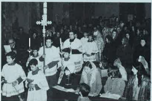
Processione con l'Urna

Favorita dal tempo buono, la festa di S. Girolamo, il giorno 8 di febbraio, si svolge con la consueta solennità. L'Urna che raccoglie i resti mortali del Santo fu portata processionalmente nel giorno della vigilia dall'altare, in cui è abitualmente custodita, all'altare maggiore dove rimase esposta alla venerazione dei fedeli fino alla sera del giorno 8. Parteciparono alle varie manifestazioni della festa, nei suoi diversi momenti, l'Eccellentissimo Arcivescovo di Bergamo, Mons. Gaddi, il quale concelebrò la Messa solenne del giorno 8 alle dieci del mattino, mentre partecipavano al rito i Parroci della Valle, tenendo poi al Vangelo con la consueta chiarezza ed efficacia il panegirico del Santo, in cui celebrava quelle virtù che a S. Girolamo permisero di dar vita a una Congregazione Religiosa ed erigere e provvedere a tante istituzioni benefiche a favore di tutti i bisognosi, ma in modo particolare degli orfanelli. Erano concelebranti con Lui, oltre ai Parroci della Valle di S. Martino, anche il Rev.mo Padre Vicario Generale della Congregazione e il Superiore di questa casa.