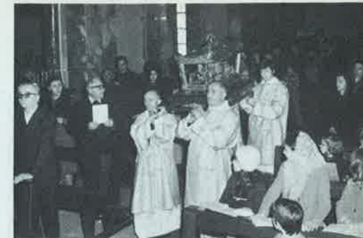
L'Urna verso l'Altare Maggiore

Abbiamo già accennato a questo argomento in un articolo dello scorso anno «un centro di vita spirituale» e continueremo a trattarne anche in seguito, perché veramente Somasca dimostra sempre più e sempre meglio la sua forza di attrazione al bene.