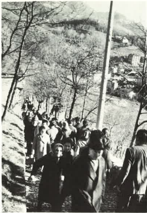
I pellegrini salgono alla Valletta