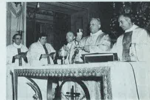
con i Parroci della Valle di S. Martino