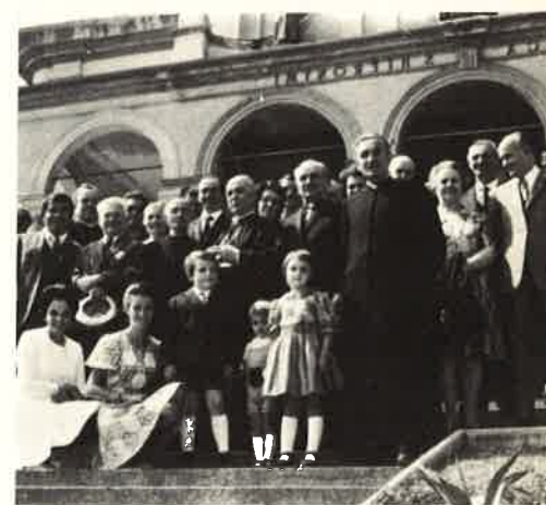
50° Mons. A. Scola