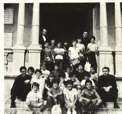
Chierichetti delle parrocchie di Lecco