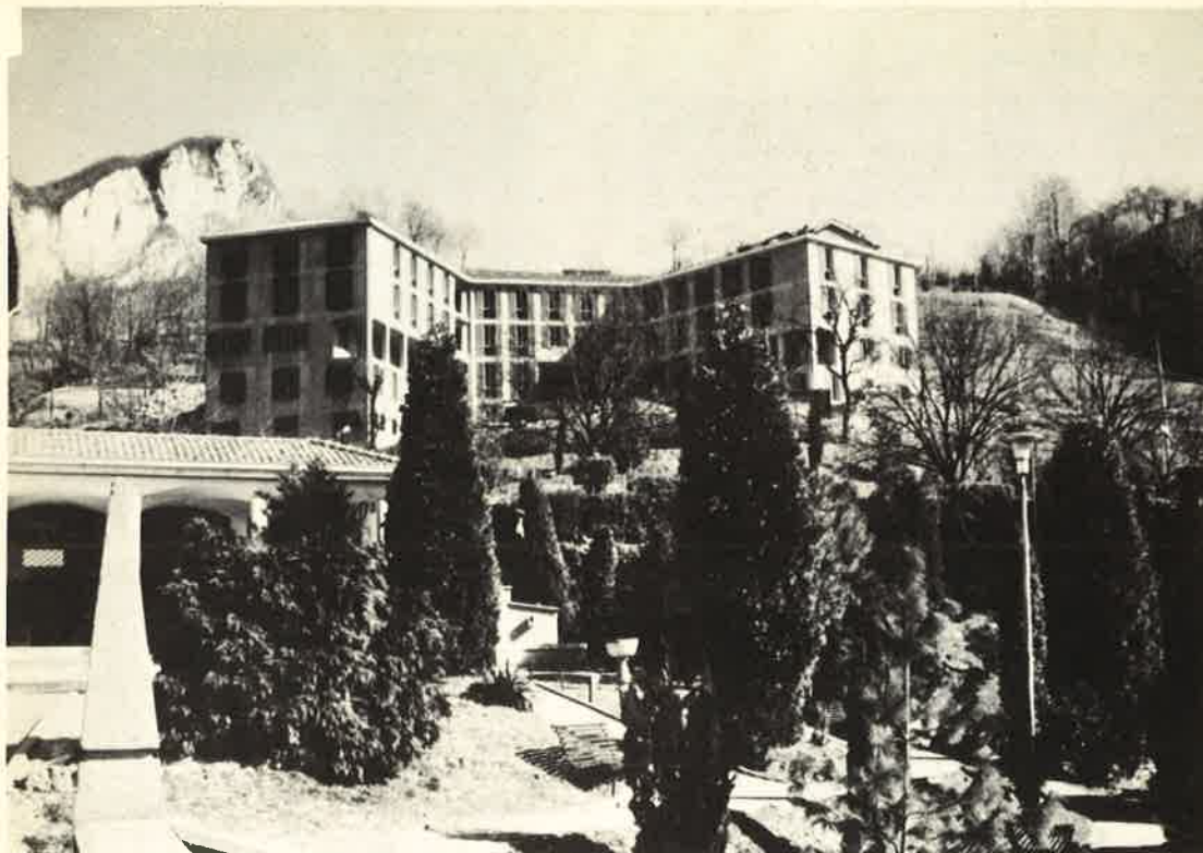
Il Santuario di S. Girolamo con il Centro di Spiritualità che attende l'aiuto di tante persone buone per la sua completa realizzazione