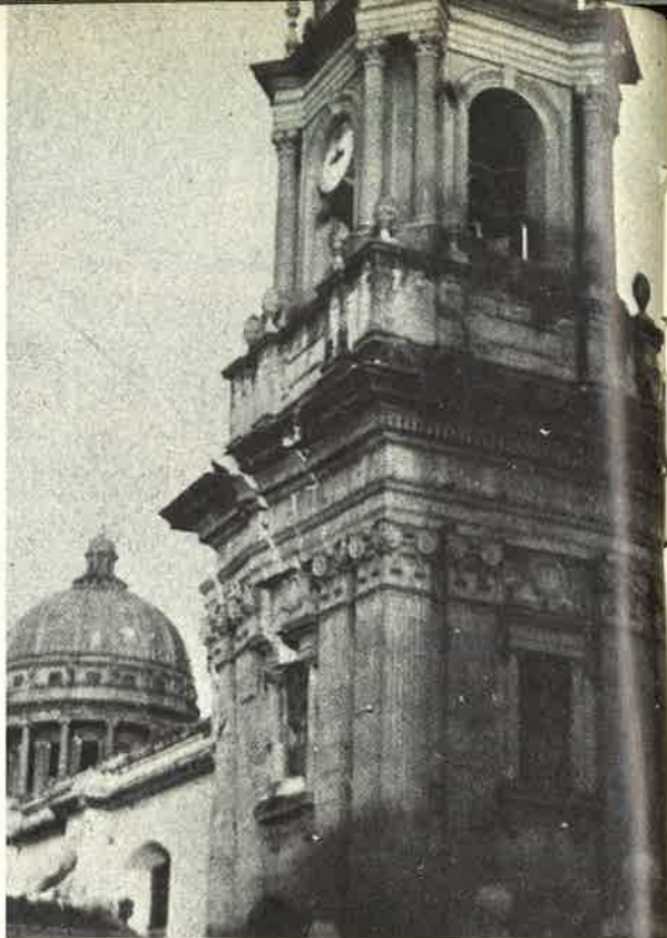
La cattedrale di Guatemala, fortemente lesionata. Arcivescovo della diocesi è il Card. Casariego della Congregazione dei Padri Somaschi.

Ai vari messaggi di invito alla solidarietà, commovente quello di domenica 15 febbraio di Paolo VI che, dopo aver ricordato che «non mancano certo temi importanti e interessanti» in questi momenti difficili, aggiungeva: «Ma uno per noi ancora prevale per la sua sconcertante gravità: quello dell'interminabile terremoto del Guatemala, il