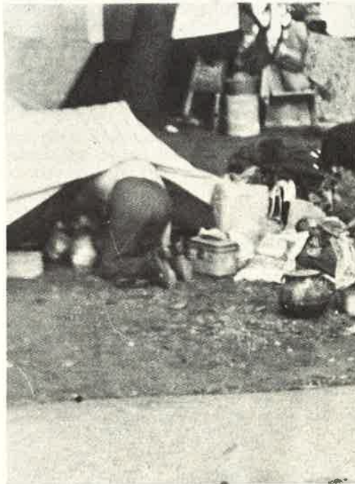
Foto in alto: una delle strade della parrocchia di S. Pedrito, sulla destra c'era l'Orfanotrofo; sopra: la gente accampata per le strade.