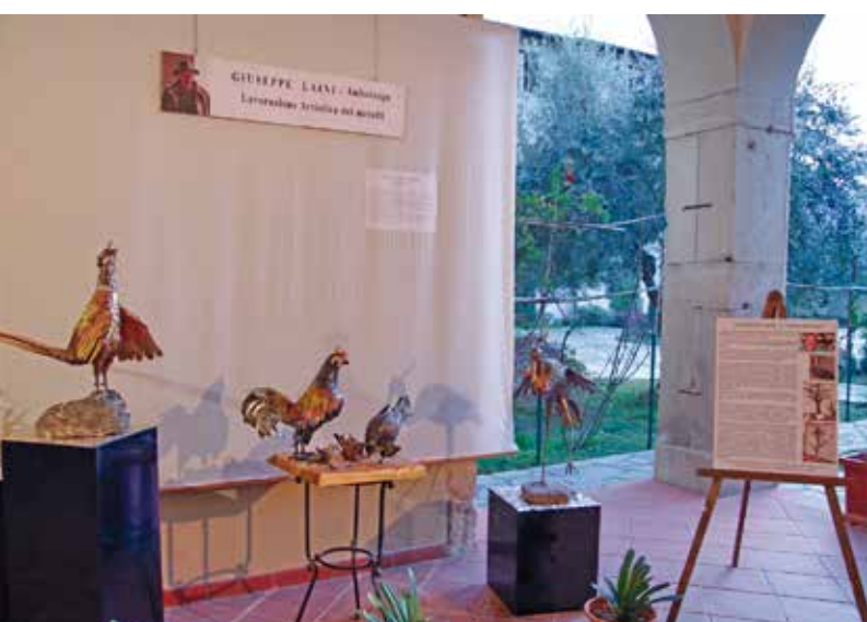
Esposizione dell'artista Giuseppe Laini