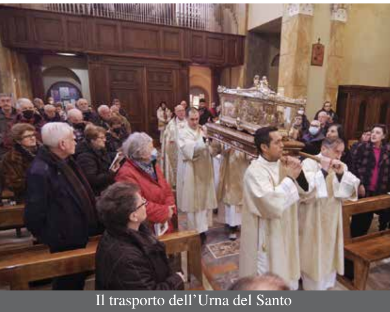
Il trasporto dell'Urna del Santo