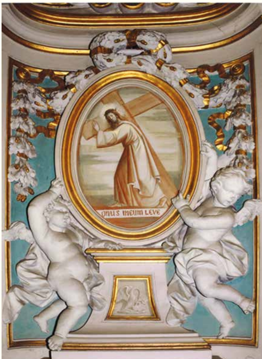
ROMA - BASILICA SS. BONIFACIO E ALESSIO ALL'AVENTINO STEMMA ONUS MEUM LEVE - AFFRESCO

Il Santuario di San Girolamo Emiliani 23808 Somasca di Vercurago (LC)