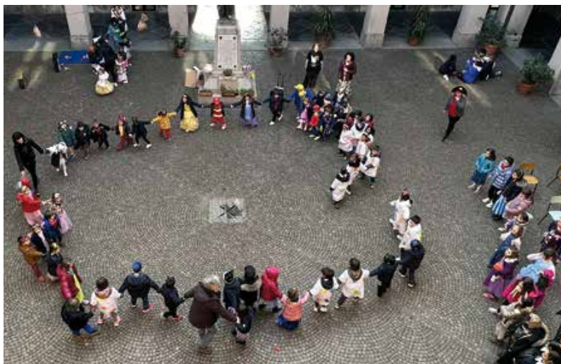
I bambini durante un momento di ricreazione

Pontificio Collegio Gallio: una scuola per la vita che sta riscrivendo il modo di fare scuola.