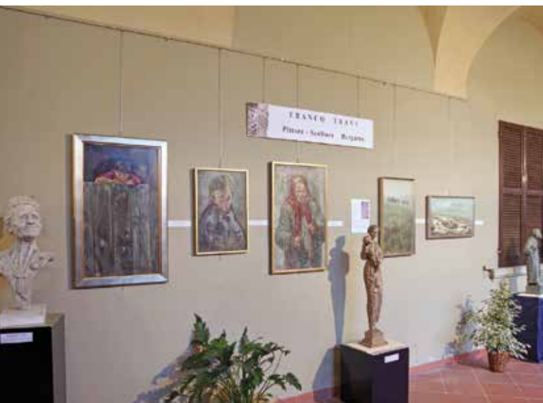
Esposizione dell'artista Franco Travi

Oltre alle mostre artistiche, collocate nel chiostro della Casa Madre dei padri Somaschi,