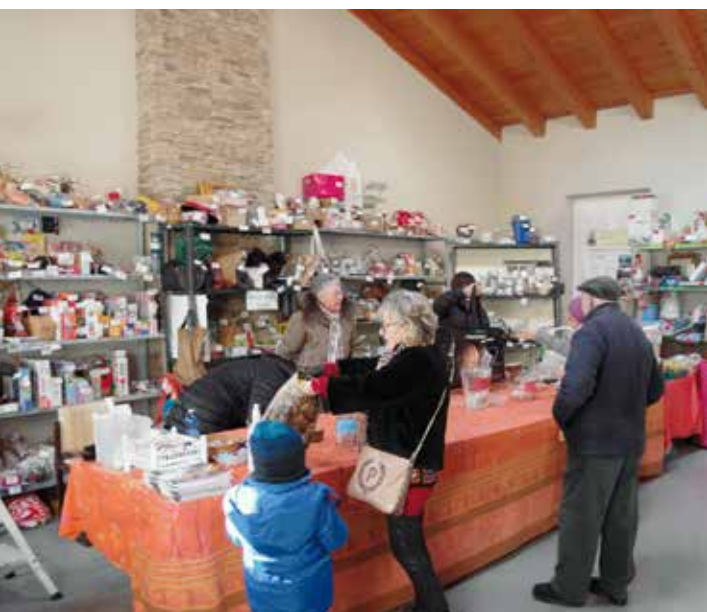
La pesca di beneficenza