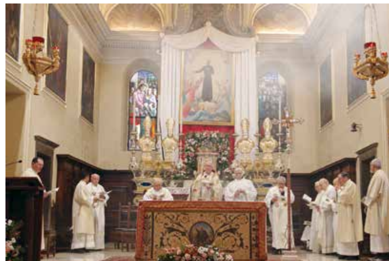
Primi Vespri d'apertura presieduti dal Padre Generale