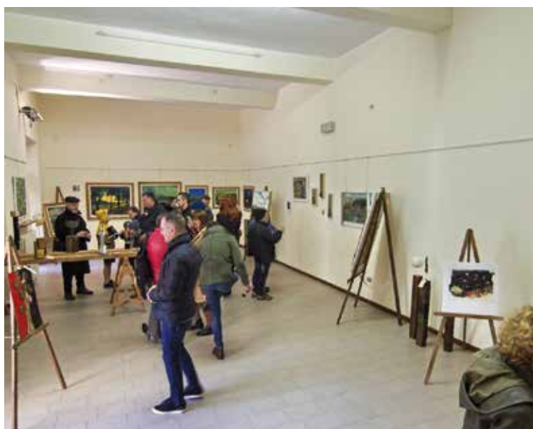
Esposizione di artisti vari