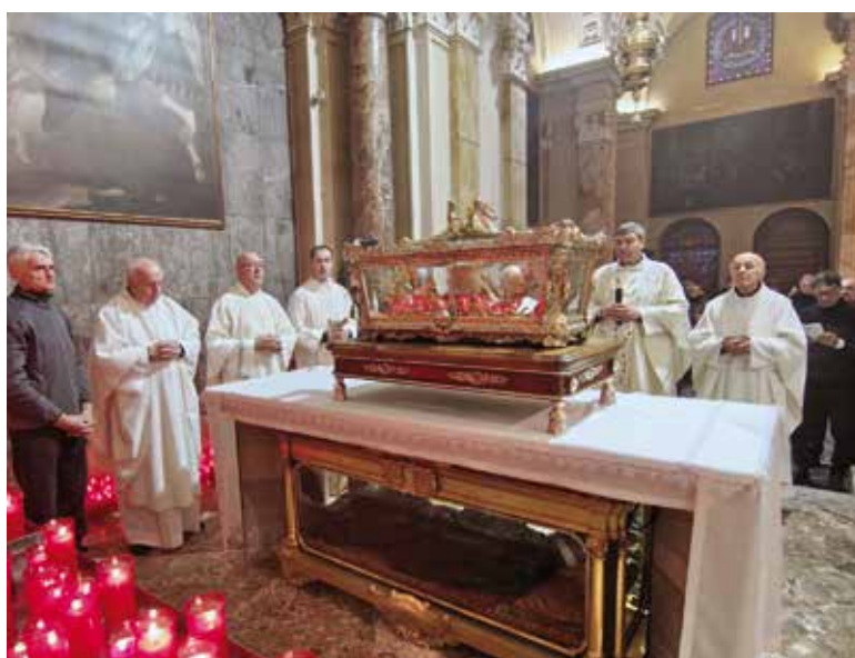
L'Urna deposta sopra l'altare del Santo