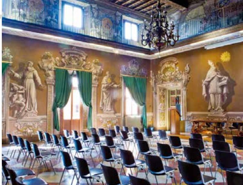
L'aula magna del Collegio

Fiore all'occhiello dell'istituto di Como, da tempo meta turistica nota in tutto il mondo, è anche la sua dimensione internazionale. Dall'infanzia ai licei gli studenti possono contare sull'insegnamento della lingua inglese con docenti madrelingua. Il livello di insegnamento della lingua