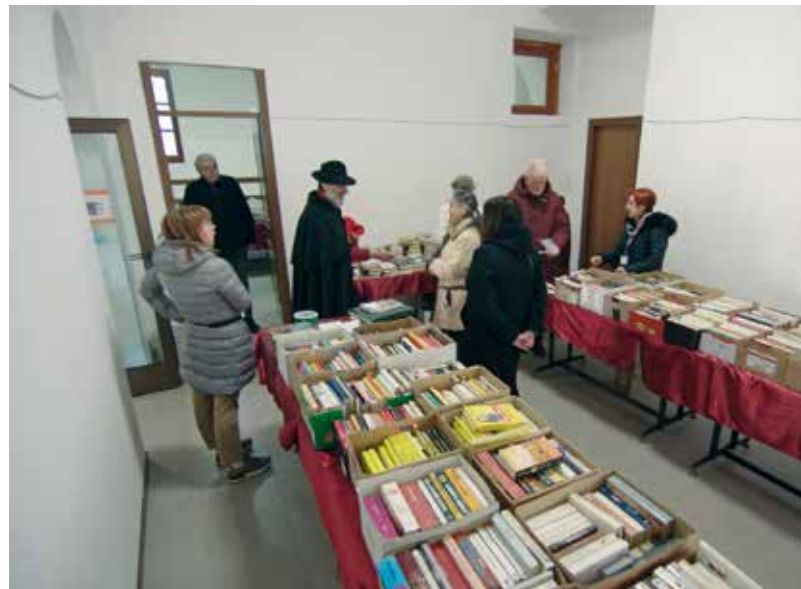
Il mercatino del libro usato

nel meraviglioso scenario di piante e fiori, era allestito anche il “Mercatino del libro usato”. Iniziativa che ha come scopo quello di promuovere la cultura attraverso la lettura che in questi tempi è molto penalizzata. Sono stati messi a disposizione centinaia di libri usati, regalati dai devoti, e che con una semplice offerta era possibile acquistare. Non pochi sono stati i pellegrini che hanno dimostrato interesse e compiacimento per tutte queste iniziative, alcuni di loro sono degli affezionati che vengono ogni anno. In uno scenario misto tra natura, cultura e arte, non potevano mancare biscotti e vin brulé, gli stessi che venivano distribuiti anche alla Valletta. Tutti i fondi reperiti, tra questi anche quelli della lotteria, sono stati destinati per i lavori di restauro delle Cappelle.