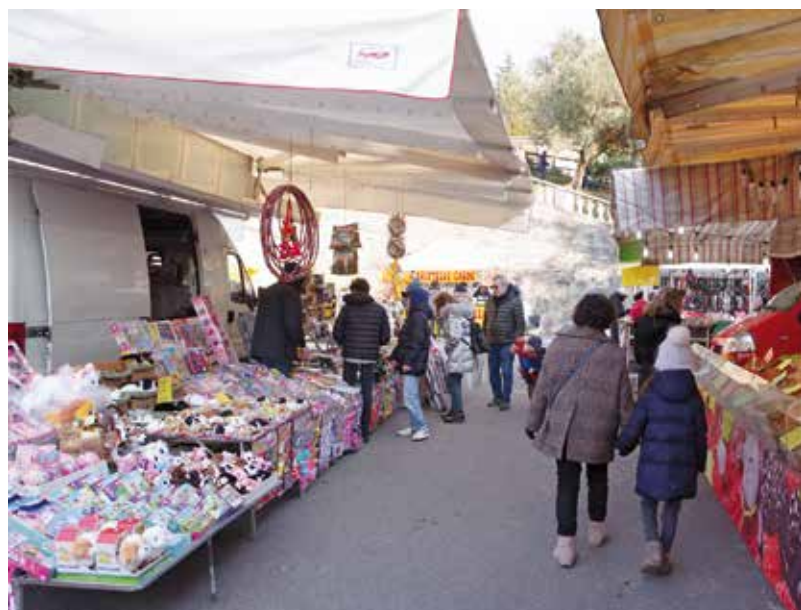
Le bancarelle, gioia di piccoli e grandi golosi