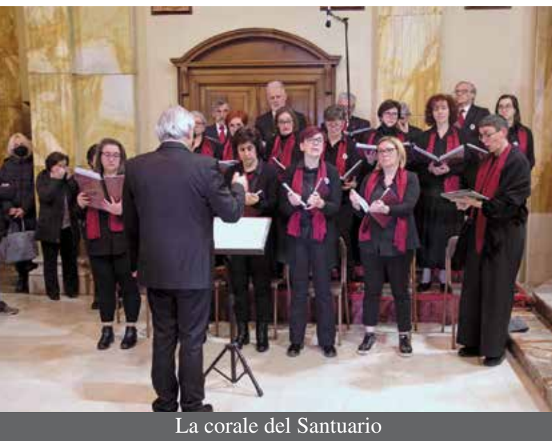
La corale del Santuario