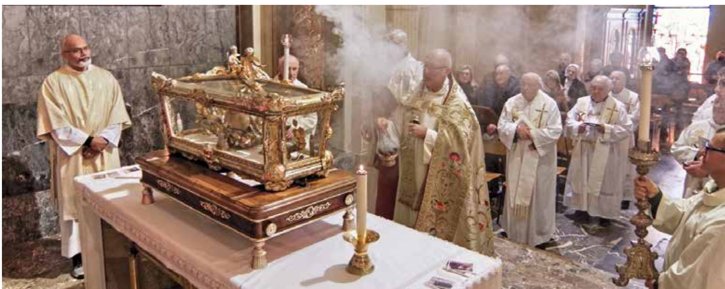
L'incensazione dell'Urna con le reliquie di San Girolamo