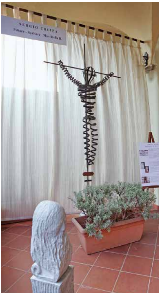
Esposizione dell'artista Sergio Crippa