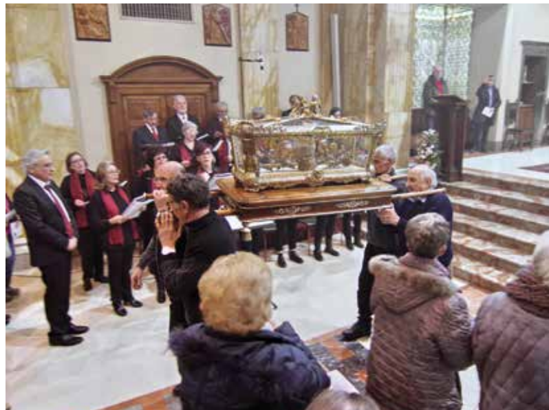
La reposizione dell'Urna trasportata dai volontari