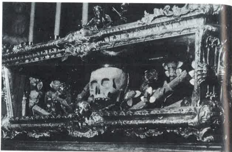
Fremito di steli e tremolar di fiammelle Da Calolzio ad Olginate

Stasera, quando il sole dietro i monti della Valmadrera e la porpora del tramonto avrà accesa la severa roccia di Mudarga e giù nel piano l'Adda avrà perdute tutte le sue scintille, il popolo di Somasca accompagnerà fino al ponte sulla Galavesa il suo Santo, che lascia la terra del suo riposo per andare benedicendo nei paesi appollaiati o distesi sulle rive del fiume o inerpicati sui fianchi della Val S. Martino. Si ripeterà così la scena frequente ai tempi di S. Girolamo Miani, allorché il Santo scendeva dalla Rocca, sostava nella casa degli Ondei, per poi andarsene, dietro la croce portata dai suoi orfani, verso i paesi vicini e lontani, ad accendere dovunque, con la sua fede di innamorato apostolo, grandi fiammate di carità divina.