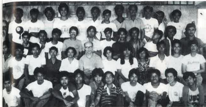
Seminaristi somaschi nelle Filippine

Nel pomeriggio i nostri chierici teologi hanno rallegrato grandi e piccoli con un ricco programma di canti, spagnoli e italiani, sketc, scenette comiche, esibizioni artistiche. Ha collaborato anche un gruppo formato da giovani della recente Parrocchia eretta nella zona della Stazione ferroviaria, particolarmente sensibile ai problemi della missione somasca nelle Isole Filippine.