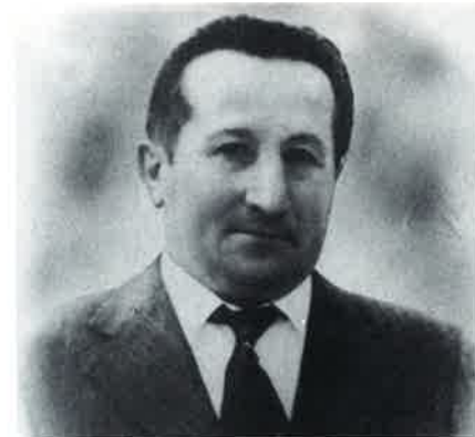
14.1.26 RIVA NATALE GALBIATE 19.11.83