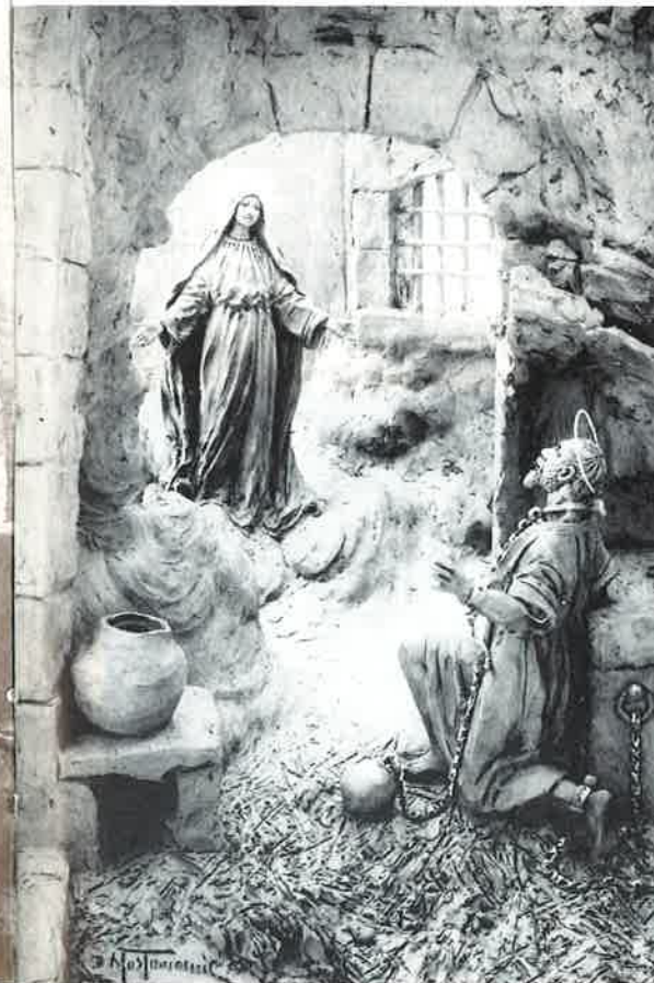
Dopo un mese di dura prigionia, viene liberato dalla Vergine SS.

Ci fu una notte di pioggia. Ma queste storie non lo riportano. Girolamo con il suo seguito trovò rifugio in un casolare di campagna. Misero insieme quel poco che avevano rimediato, troppo poco per un pasto decente; allora decisero di coricarsi. Ma lo stomaco brontolava. E si sa che lo stomaco dei ragazzi quando brontola per fame raggiunge tonalità acutissime. Coprendosi alla meglio tentarono di prendere sonno e stranamente calò su