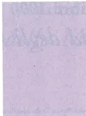
Valletta: S. Girolamo che riposa sulla pietra.