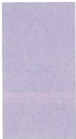
Valletta: Cappella delle benedizioni.