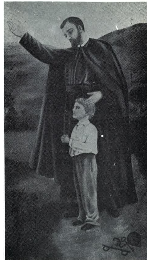
Tela di Carmen López Rios

Mi si consenta di introdurre con un ricordo personale. Sono nato e ho passato tutta la mia infanzia in quella parte della Brianza che sta verso l'Adda. O sia per ragioni storiche, avendo Somasca appartenuto fino alla fine del 700 alla diocesi Milanese, o sia semplicemente per ragioni di vicinanza, sta di fatto che per i paesi di quella parte di Brianza il Santuario di Somasca era, ed è tuttora, una delle mete preferite di pellegrinaggio, uno, direi, dei “nostri” Santuari. E per noi lo stesso no-