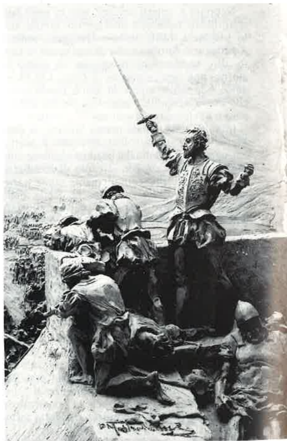
Capitano della Repubblica Veneta, Girolamo Miani difende Castelnuovo di Quero sul Piave (1511).

e degli amici s'era messo a raccogliere i ragazzi di strada, gli orfani, i figli di nessuno, i giovanissimi mariuoli già esperti nel maneggiare il coltello o nel far una