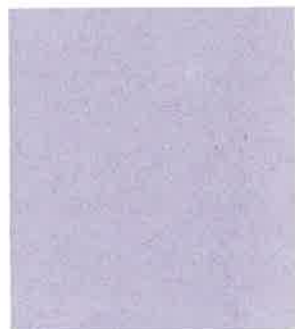
Panorama della Valletta.