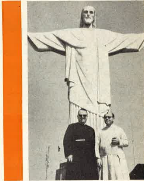
Il P. Generale con il P. Commissario sul Corcovado

La parrocchia tenuta dai Nostri e dedicata a Cristo Redentore è posta tra l'aeroporto e il centro della città, con una popolazione valutata sulle 30.000 anime, in una zona socialmente intermedia, ma con larghe frangie di « favelas », dove necessita impostare un lavoro apostolico tipicamente missionario. I nostri Padri vi lavorano con grande zelo e con visibili risultati. Una grande strada di collegamento ha letteralmente spaccato in due il territo-