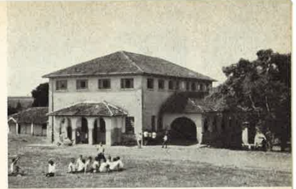
L'Istituto di Uberaba

Il giovedì santo, grande festa nell'Istituto: Prima Comunione e Cresima di quattordici orfani, uno dei quali (un bel moretto dodicenne) fu da me personalmente battezzato. Il giorno di Pasqua ho celebrato la Messa in una cappella dispersa in piena campagna: S. Rosa, dove una massa di giovani specialmente, sbucata non so da dove, si è ritrovata per compiere il proprio dovere.