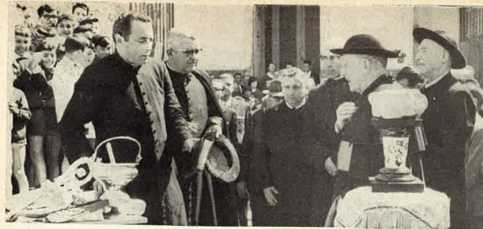
Mons. Vescovo benedice e posa la prima pietra

Questo sforzo sostenuto con spirito puramente apostolico e umanitario non poteva non essere appoggiato dal Mi-