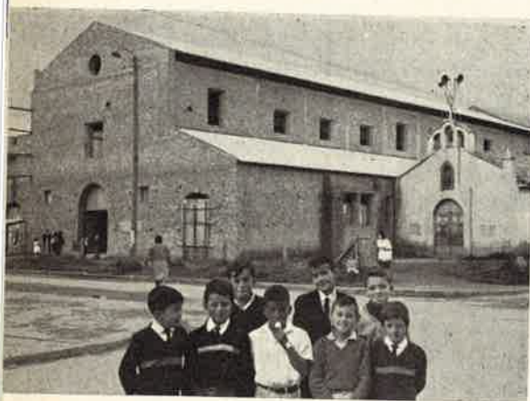
Bogotá: la nuova Chiesa Parrocchiale.