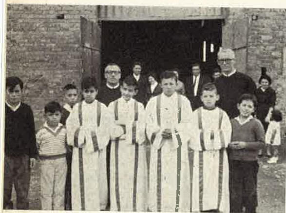
Bogotá: il piccolo clero.

stato utilissimo in vista di ulteriori sviluppi dell'opera nostra in Brasile, quando naturalmente saranno aumentati gli operai evangelici. Questo viaggio, imprevisto, mi ha costretto a modificare i piani già predisposti in partenza dall'Italia e fu motivo di qualche disagio, al punto che i Confratelli di Rio rimasero in ansia e incerti sulla mia sorte quasi due giorni, non vedendomi tornare. Nell'interno del Brasile non è cosa fuori del comune che un telegramma giunga a distanza di parecchi giorni o anche mai!