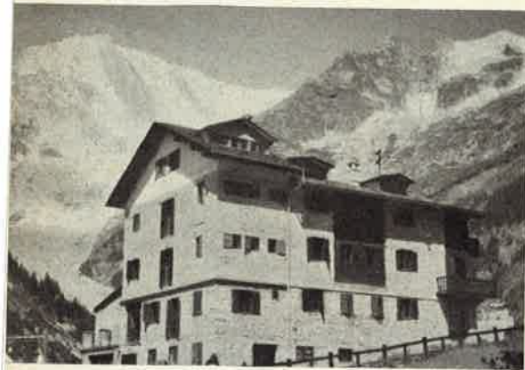
La Casa Alpina dei PP. Somaschi ad Entrèves di Courmayeur (sullo sfondo il Monte Bianco)

Noi ammiriamo l'ardimento di questo coraggioso e, standocene sicuri e borghesemente quieti presso il rifugio raggiunto in macchina o in funivia, ne seguiamo con il cannocchiale, funzionante con la monetina da 20 lire, le ardite evoluzioni e i passaggi di sesto grado spinto.