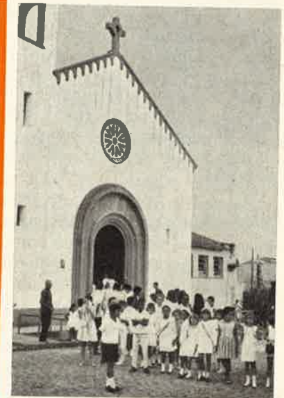
Rio de Janeiro: La Parrocchia di Cristo Redentor

All'aeroporto di Rio de Janeiro mi attendevano i Padri Papagno e Pietrangelo. Commovente l'incontro: il primo con i Confratelli d'oltre oceano. I Padri Somaschi sono in Brasile da poco più di tre anni. Vi furono chiamati dal Card. Jaimes Camara, Arcivescovo di Rio, che, come Cardinale, è titolare della nostra basilica di S. Alessio in Roma. Hanno due case: la prima a Rio (vasta parrocchia nella periferia della città); la seconda a Uberaba, nello stato del Minas Gerais (Istituto per ragazzi abbandonati e parrocchia).