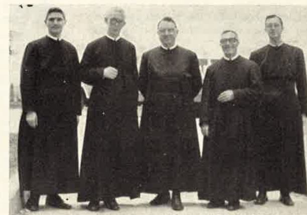
Colombia: La Comunità del Commissariato attorno al P. Generale.