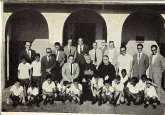
Autorità e cresimati a Uberaba