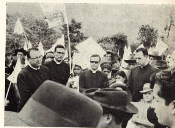
Il P. Generale accolto a Zetaquirá.

moralmente a rispondere di sí a tanta generosità e spontaneità. Incoraggiati anche dall'Arcivescovo locale, presto vi apriremo il primo seminario somasco in terra di Colombia.