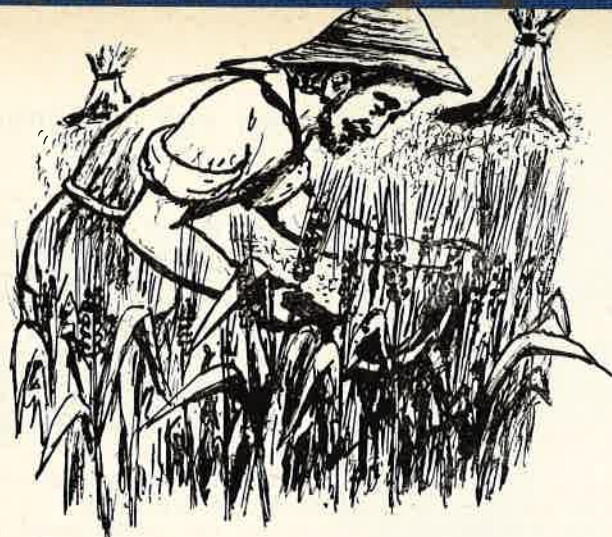
Il patrizio si fece contadino.