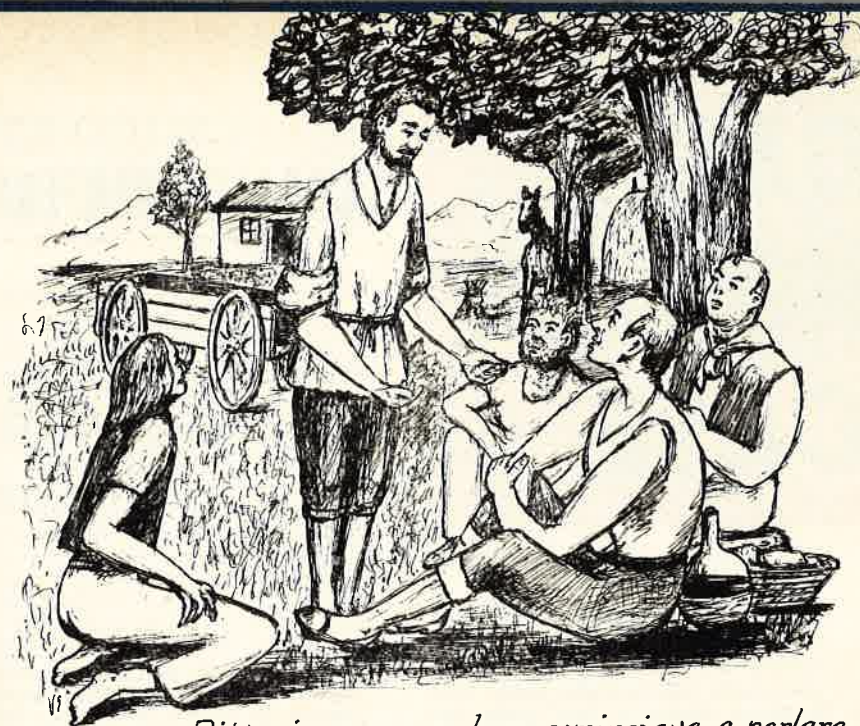
Ritto in mezzo a loro, cominciava a parlare.