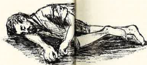
Dormiva per... ma per poco...

Ma là nessuna chi veramente egli fosse. Solo sapevano i contadini che il forestiero di lontano parlava loro di Dio, parole che facevano scoppiare di tenerezza il cuore, chiedeva in compenso del suo po' di pane e un bicchier d'acqua, per terra o su un po' di paglia, ma no, perché la notte