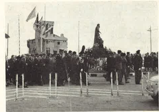
La Processione per le vie di Rapallo.

Il Rev.mo Padre Generale prendeva quindi la parola per ringraziare le Autorità e la cittadinanza e per assicurare che il miglior ringraziamento l'avrebbero dato i Padri del « San