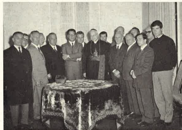
Il Patriarca riceve l'omaggio dei Sindaci e Autorità della Valle.

DIREZIONE - AMMINISTRAZIONE PIAZZA S. ALESSIO, 23 - ROMA - Pubblicazione mensile per gli amici dei Padri Somaschi - Abbonamento annuo L. 1.000 - Sostenitore L. 2.000 - c.c.p. 1/41191 - Curia Generalizia PP. Somaschi - Piazza S. Alessio, 23 - Roma Dirett. Responsabile: Giovanni Gigliozzi - Sped. in abb. postale - Gruppo IV Autorizzazione del Tribunale di Roma n. 6768 (5 marzo 1959) - Tipografia Città Nuova - Grottaferrata (Roma)