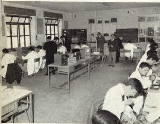
Laboratorio radio T.V.

Somasca. Venerdì 29 settembre presso il Noviziato è stata celebrata la festa della Vestizione religiosa dei nostri giovani e sabato 30 quella della Professione dei voti temporanei. Pubblicheremo cronaca ed elenco nel prossimo numero di VITA.