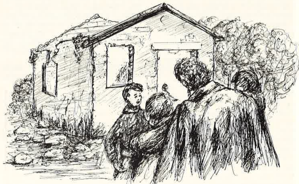
Si trascina faticosamente fino ad un vecchio casolare.