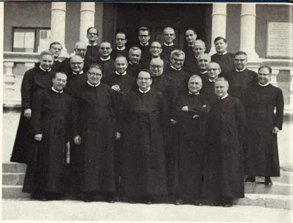
I Padri del Capitolo attorno al P. Generale.

sa presso l'altare di S. Girolamo, nel soave ricordo di Papa Giovanni così devoto del nostro Santo, trascorrendo poi la serata con la Comunità religiosa e ricordando fatti ed episodi del Pontefice venerato.