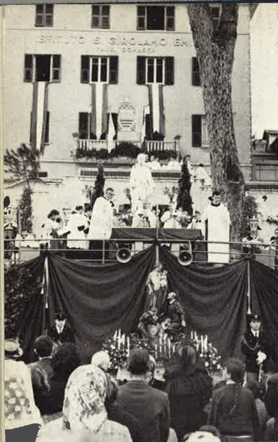
La chiusura delle feste presso l'Istituto Emiliani.

Francesco » e dell'« Emiliani » con la loro abituale paziente silenziosa opera, continuatrice di quella del loro Santo Fondatore.