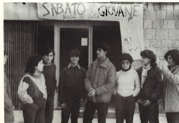
Anche prima e dopo l'incontro lo stare insieme è sempre un conoscersi che ci apre a chi è vicino o incontriamo per la prima volta

Il programma è sempre diverso: canti, mimi, esperienze, giochi, scambi di vita sul Vangelo, preghiera giovane, e tutto quanto è mezzo per esprimere la nostra gioia, la nostra fede e la nostra amicizia. E' veramente una "festa di vita" perché è costruita da tutti, come in una grande famiglia, festa che vorremmo durasse tutti i giorni, per gridare con la vita che è bello oggi essere cristiani.