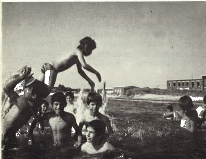
Estate: acqua, sole e... serenità

In tale contesto i ragazzi della scuola media che venivano accolti conducevano la loro vita impegnandosi a vivere il Vangelo, nello studio, nello sport, nei vari incarichi affidati ad ognuno per costruire insieme lo spirito di famiglia.