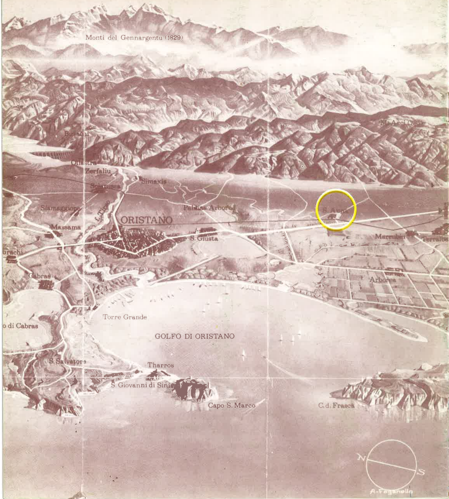
Monti del Gennargentu (1829)