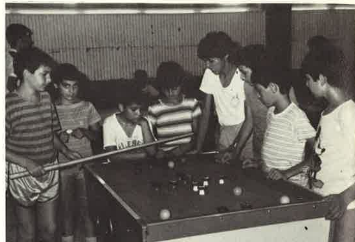
Anche i giochi al coperto aiutano a trascorrere insieme ore serene

Belle erano anche le passeggiate al Monte Arci o i giochi nei boschetti di sugheri, "mudregu" ed eucaliptus.