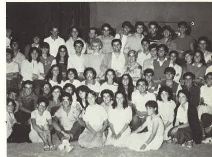
Giovani della comunità interna ed esterna insieme per l'esperienza del campo di lavoro

Anche quattro ragazze universitarie, che facevano parte dei gruppi esterni, il 15 settembre 1983 sono entrate tra le Missionarie Figlie di S. Girolamo, e si stanno preparando a diventare missionarie.