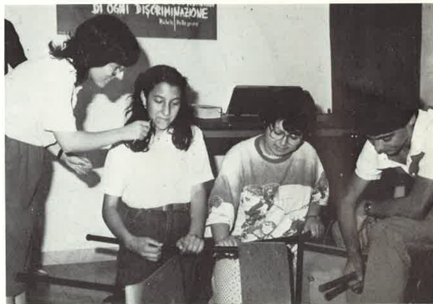
Una scenetta del gruppo "Nuova Speranza" durante un campo di lavoro