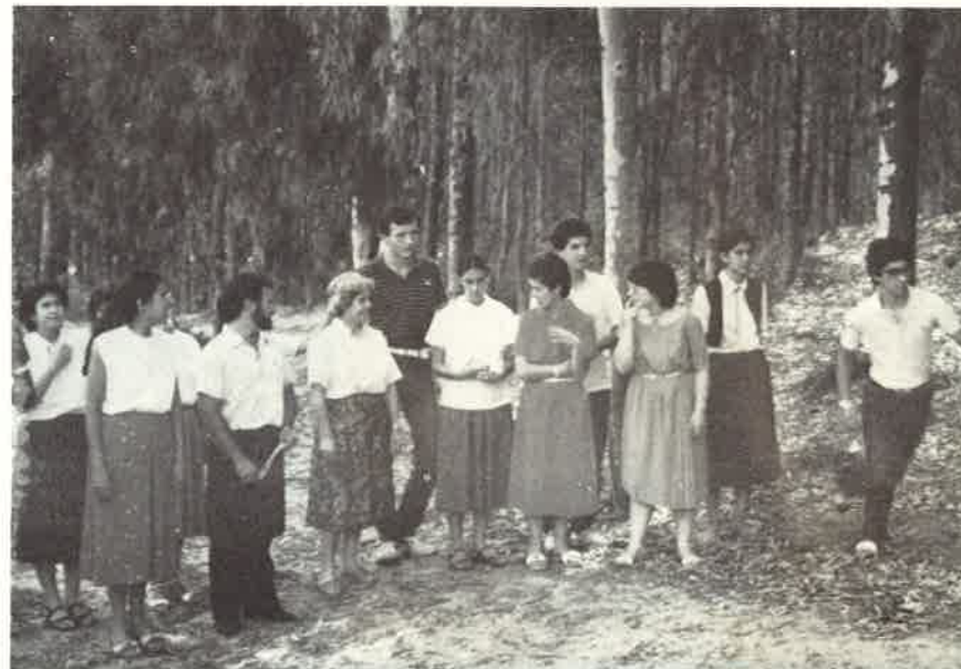
I giovani del gruppo in un momento di relax tra gli eucaliptus

Tutto questo non è facile, date le difficoltà del mondo che ci circonda: per questo è necessaria una formazione chiara e profonda, che dia al giovane la sicurezza che viene dall'esperienza di fede vissuta di persona.