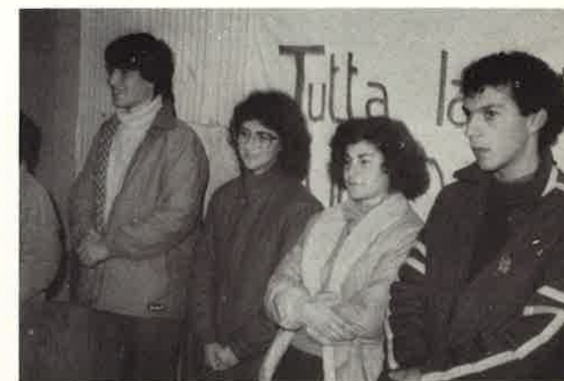
Sabato Giovane è costruito da tutti; insieme si sperimenta che 'tutta la vita è un dono'