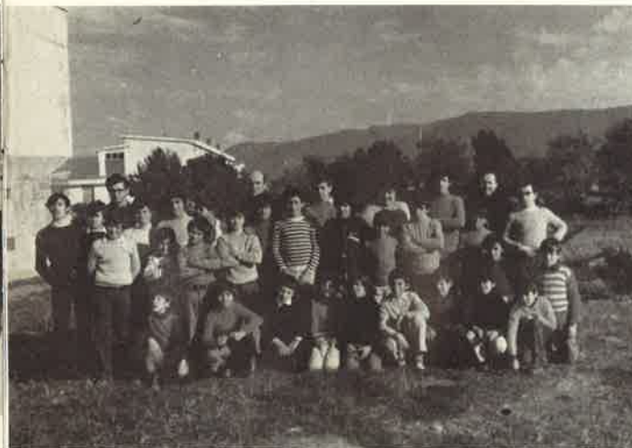
La comunità dei Padri e dei ragazzi nel 1973

Oggi entra il primo gruppo di 27 piccoli seminaristi sardi. Il Signore benedica quest'opera nata in mezzo a tanti sacrifici e destinata alla maggior gloria di Dio e al bene delle anime".