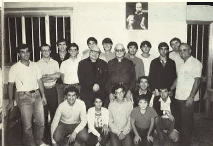
1983: Padri e giovani aspiranti seminaristi riuniti attorno al P. Provinciale

Così, a poco a poco, col passare degli anni, dal 1965 al 1980 più di duecento ragazzi hanno condiviso la nostra vita e hanno frequentato le scuole medie nel nostro Istituto.