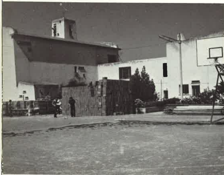
L'ampliamento della casa, realizzato nel 1977, è stato un passo fondamentale per la vita di tutta la comunità

Quando il 7 settembre 1978, dopo aver fatto il giro di tutte le famiglie della Parrocchia, ritornava a casa alla vigilia della sua partenza da S. Anna, ad un Confratello che gli leggeva sul volto i segni evidenti della commozione e gliene chiedeva il motivo, rispondeva: "Non credevo che si potesse soffrire tanto a lasciare S. Anna dopo nove anni di permanenza tra questa buona gente ..." È una testimonianza che esprime più di tante parole.