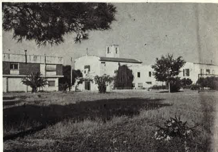
S. Anna di Marrubiu: la Scuola, la Chiesa, l'Istituto e... tanto spazio per correre e giocare