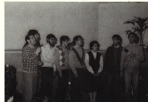
I mimi, le testimonianze, il cantare, il giocare e il pregare è tutto un modo per poterLo lodare