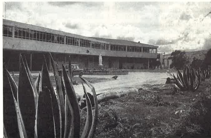
In alto a sinistra: la facciata della , a festa, di santa Inés a Bucaramanga