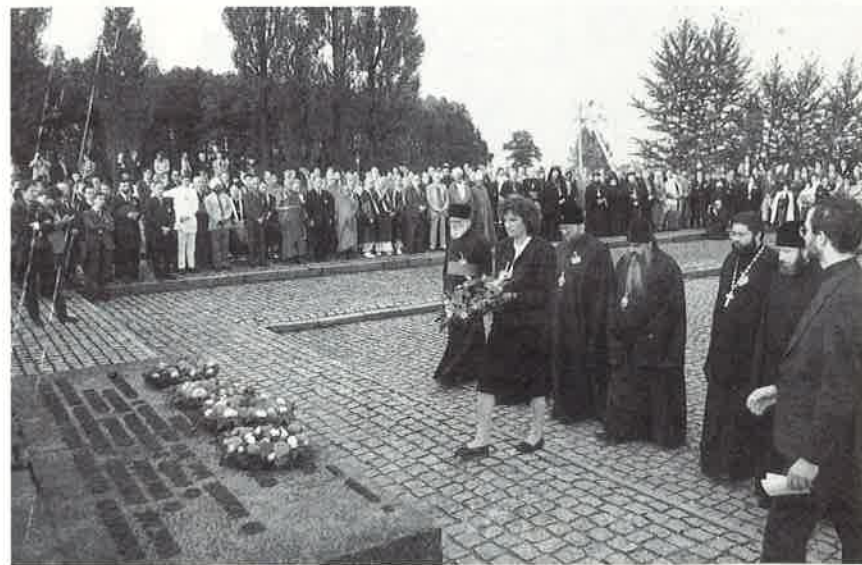
Sopra: l'omaggio della delegazione della Chiesa ortodossa nel campo di concentramento polacco di Birkenau

Non era previsto dal protocollo, ma l'anglicana Bates, inglese, e il tedesco Lehmann, guidavano il corteo: vincitori e vinti. □