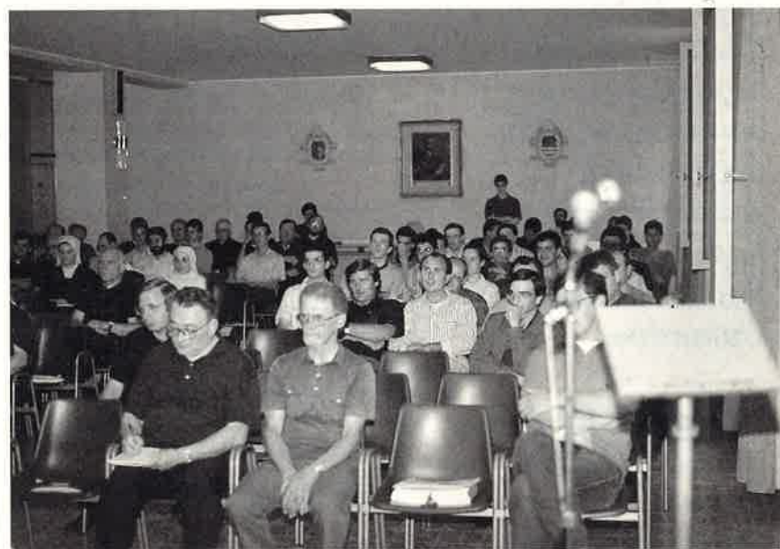
◀ Somasca: l'attenta assemblea ascolta con partecipazione l'esperienza raccontata dai relatori

Con le bellissime storie narrate è risuonato l'appello a lasciarsi svegliare dalla carità, che si fa domanda di conversione attraverso le richieste degli ultimi e diventa recupero di energie di bene per affrontare situazioni inedite.