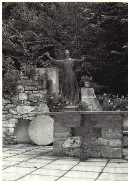
◀ Un angolo del parco del Centro di spiritualità a Somasca, dove si è svolto l'incontro

manente deve essere espressa sempre dall'associazione. Tutto il gioco è di fare in modo che il territorio si mobiliti, che la gente che ci sta attorno e che si accorge possa essere invogliata ad accogliere, possa essere tenuta in formazione per far sbocciare la disponibilità dichiarata all'accoglienza.