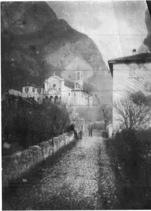
Veduta della strada che immette a Somasca, con sullo sfondo la facciata della chiesa dopo l'ampliamento del 1893 (foto d'epoca, s.d.; originale conservato a Genova, Archivio Storico Padri Somaschi, colla segnatura: H-23-101).

Vercurago, che dopo fu fatta dorare ed inargentare. Si rivestì poi dentro di seta, e così si ebbe il tabernacolo all'altare della Madonna, di marmo dello stesso stile dell'altare, da sembrare d'esser stato fatto appositamente”.