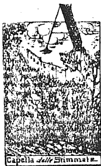
Capella della Stimmat.

Questa chiesa, infine, per esser allora parrocchiale, non era certo ufficiabile da religiosi della vita eremitica, quali si dicevano ed erano in realtà allora i Cappuccini. Neppur poteva facilmente esser loro consegnata, se non dopo lunghe pratiche per la traslazione ad altra chiesa dei diritti parrocchiali. Sicchè la permanenza dei primi Cappuccini in S. Croce deve esser esclusa affatto.