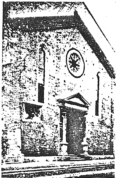
Verona, la Chiesa di S. Maria della Scala, da una vecchia stampa