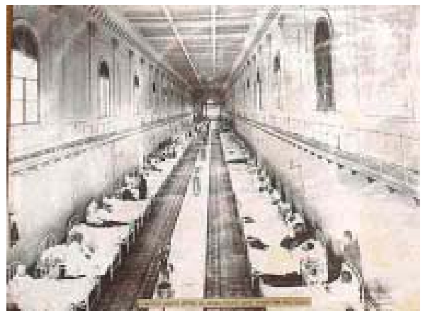
Prima della ristrutturazione questa era la "Corsia Genga" al primo piano, sul lato di "Via del Corso"