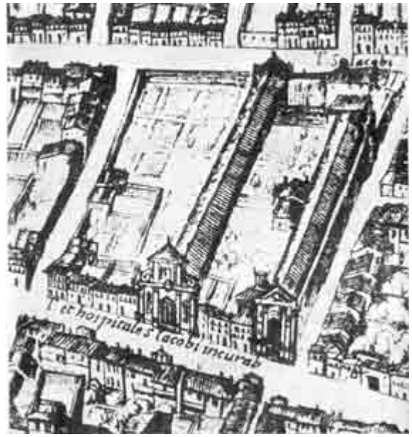
1583 - Pianta di A. Tempesta