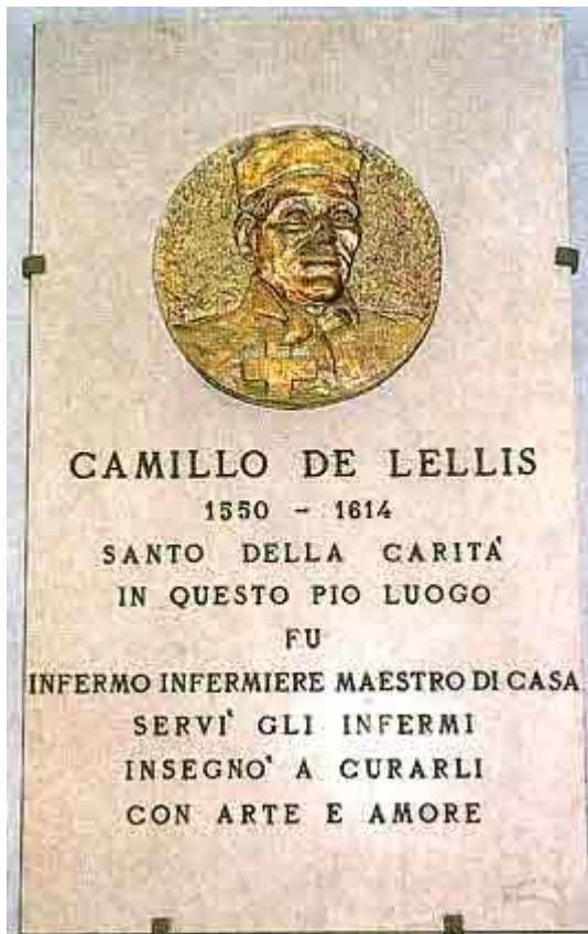
Questa la "Lapide" posta nel 1975, 400.mo Anniversario della Conversione di San Camillo