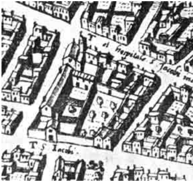
1575 - Pianta del Du Pérac-Lafréry