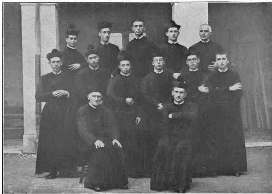
Noviziato di Somasca — Professione Religiosa semplice 29 Settembre e 15 Ottobre 1933.