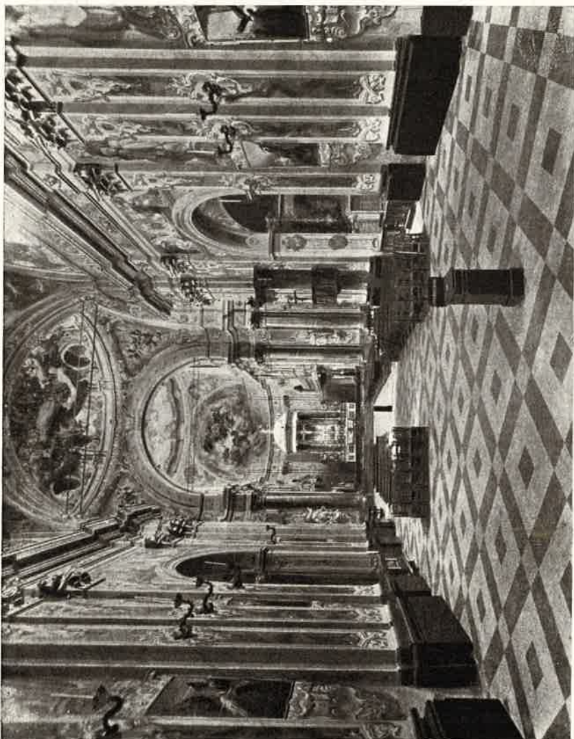
INTERNO DEL SANTUARIO DEL SS. CROCIFISSO.