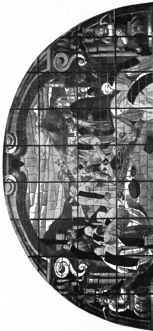
VETRATA CHE RIPRODUCE IL MIRACOLO DEL SS. CROCIFISSO.

L'interno è a croce latina e di stile barocco e misura 70 metri di lunghezza. Sebbene le singole parti risentano alquanto dei tempi diversi in cui furono costruite, pure a tutta prima non se ne rilevano i difetti, anzi, ora specialmente che tutto il tempio è stato mirabil-