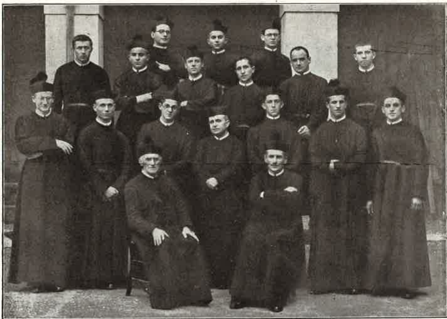
Noviziato di Somasca — Vestizione Religiosa — 29 Settembre 1933.