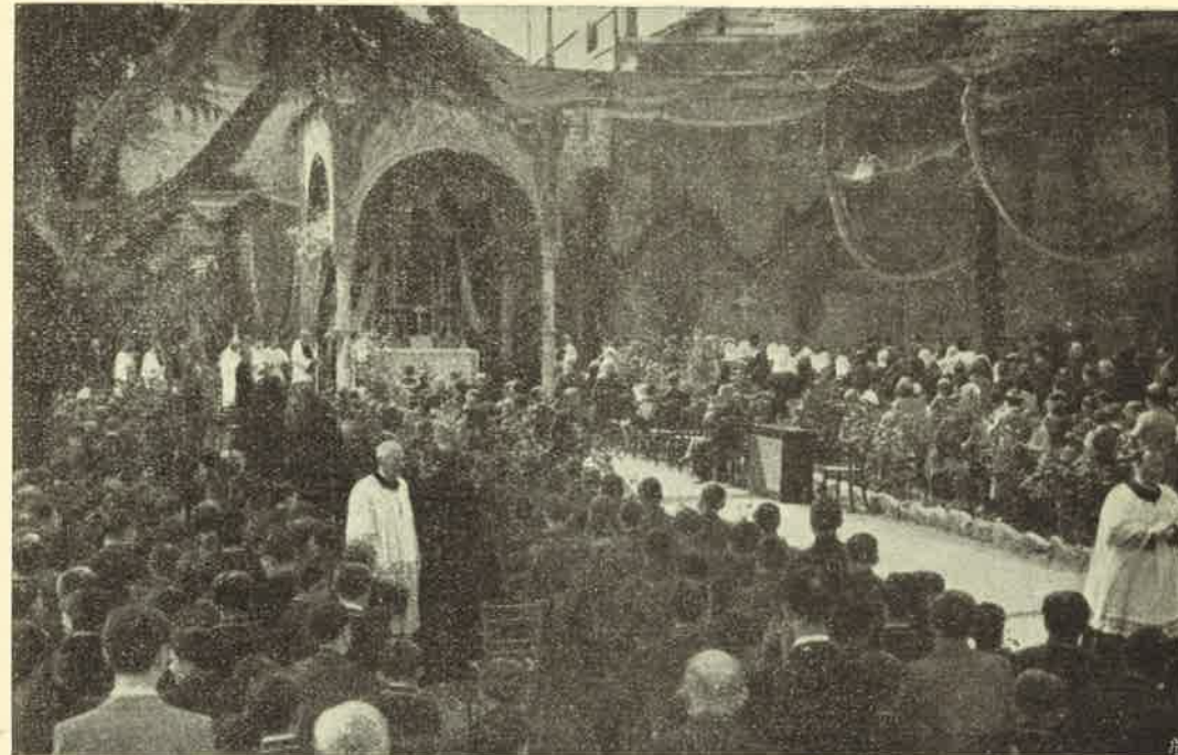
Feste Centenarie al Collegio Gallio: Concorso di Istituti

La città di Como possiede di S. Gerolamo, oltre i ricordi storici simpaticissimi del contatto del 1536, anche una preziosa reliquia: un anello della catena di cui fu ammanettato nel carcere di Quero e da cui fu sciolto da Maria SS. Esso si conserva nella basilica della SS. Annunciata. Intorno a esso si svolse naturalmente ogni festività. Perciò con la massima solennità fu portato processionalmente dalla basilica al Collegio.