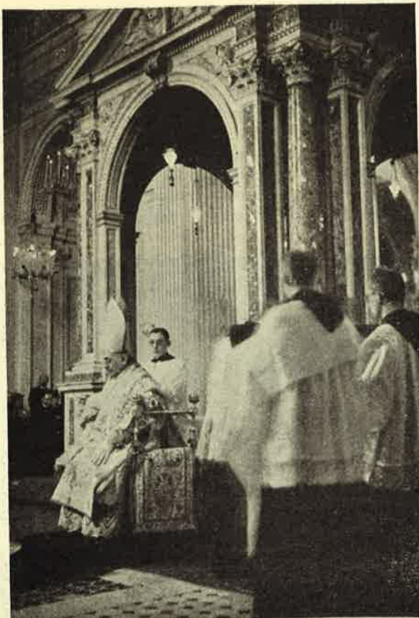
Basilica di S. Alessio Il solenne Pontificale all'altare della Confes- sione.

sono attribuire le parole di S. Paolo: Signa apostolatus mei facta sunt super vos.