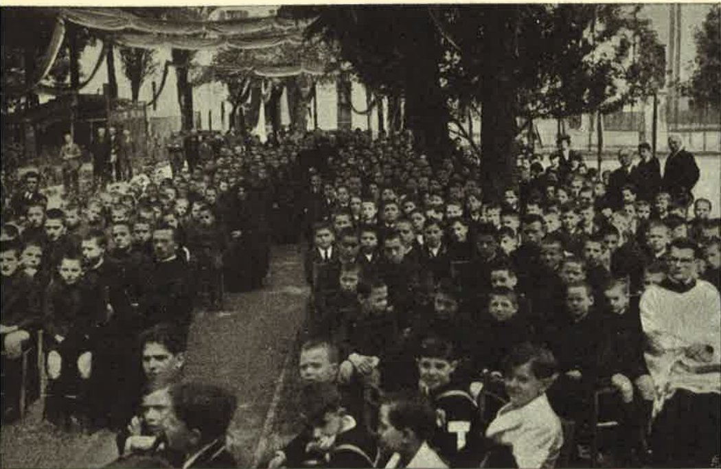
Feste Centenarie al Collegio Gallio: Istituti nei giardini - Altro gruppo.

immensa degli eletti, della quale S. Giovanni confessa l'interminabile teoria. In questa S. Girolamo Emiliani. Divideva quindi l'Ecc.mo oratore la sua omelia in una armonica trilogia riassuntiva della vita del Santo. Una grandezza da ammirare: i cenni biografici con la nascita in Venezia nel 1481, la vita avventurosa del soldato 1508 al 1516, quando in un'aspra battaglia venne fatto prigioniero e incatenato nel Castello di Quero, ove sarebbe avvenuto l'intervento miracoloso della Madonna con spezzargli la ferma catena, diventando seguace perfetto di Gesù Cristo. Accenna alla solitudine di Somasca e all'inizio del suo apostolato santo diventando il primo fondatore degli Orfanotrofi e il patrono della gioventù abbandonata, come nel 1928 si degnava dichiararlo S. S. Pio XI.