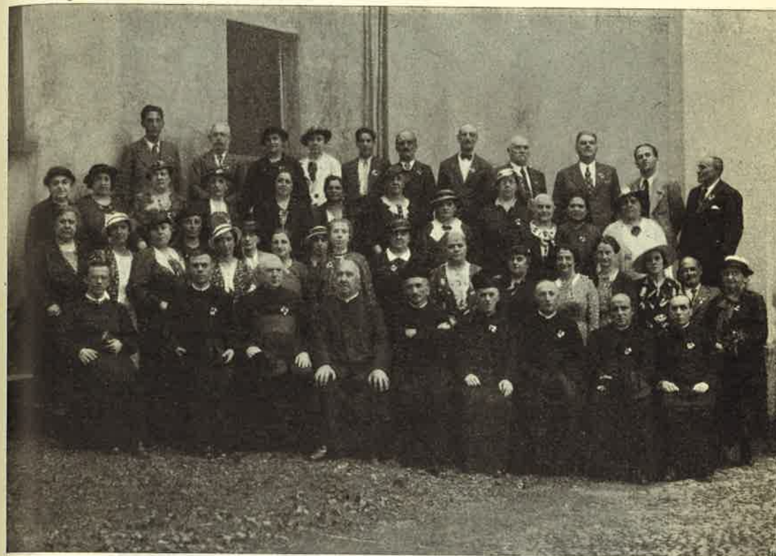
Pellegrinaggio genovese a Somasca