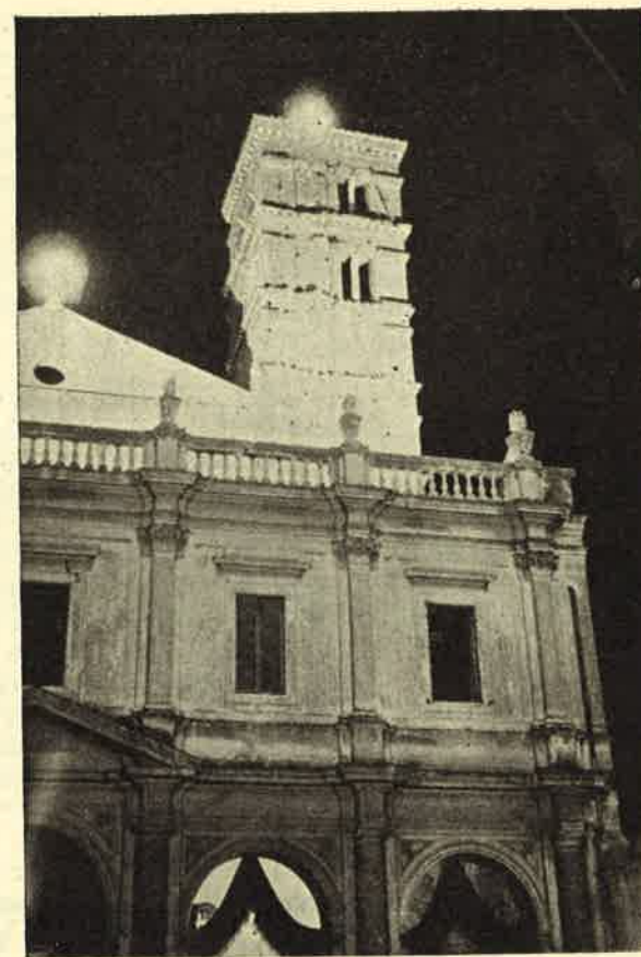
Basilica di S. Alessio Illuminazione della Fac- ciata e del Campanile.