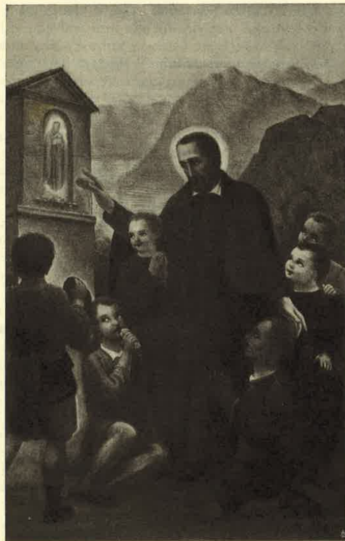
Carlo Cocquio: S. Girolamo presenta gli orfanelli alla S. S. Vergine (2/o affresco)

È ancora quella? Non è più quella? — Sono le interrogazioni che ci si fanno dai pellegrini per la cappelletta che segna la via a Somasca dalla Gallavesa. E sì! La composizione dell'impostazione della scena è ancora quella di prima; cioè del Santo nostro in atto di educare fanciulli alla pietà cristiana verso la Vergine Madre di Dio: ma è lavoro fatto di nuovo sopra un'altra parete di mattonelle bucate e tenuta staccata dal muro maestro ove era dipinta la stessa scena, che presto si guastò causa la cattiva preparazione dell'intonaco. E pare un'altra per la maggiore contenutezza quanto ai panneggiamenti dei ve-