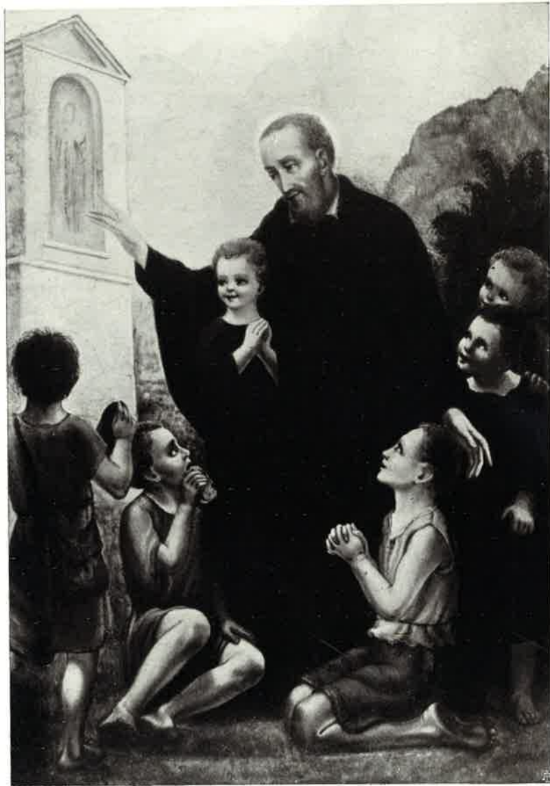
Carlo Cocquyo: S. Girolamo presenta gli orfanelli alla S. S. Vergine (1/o affresco)