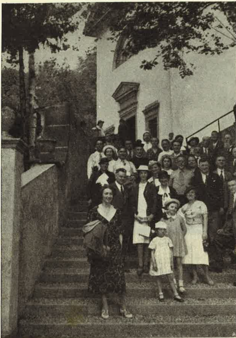
Pellegrinaggio della F. I. E. R. O. - Altro gruppo.

Qui durante la S. Messa, sentirono il fervore di uno dei padri della casa, che li esortava alla imitazione del santo specialmente nella devozione alla Madonna. Indi salirono alle Cappelle, alla Valletta, alla Scala Santa. La soddisfazione fu totale e universale.