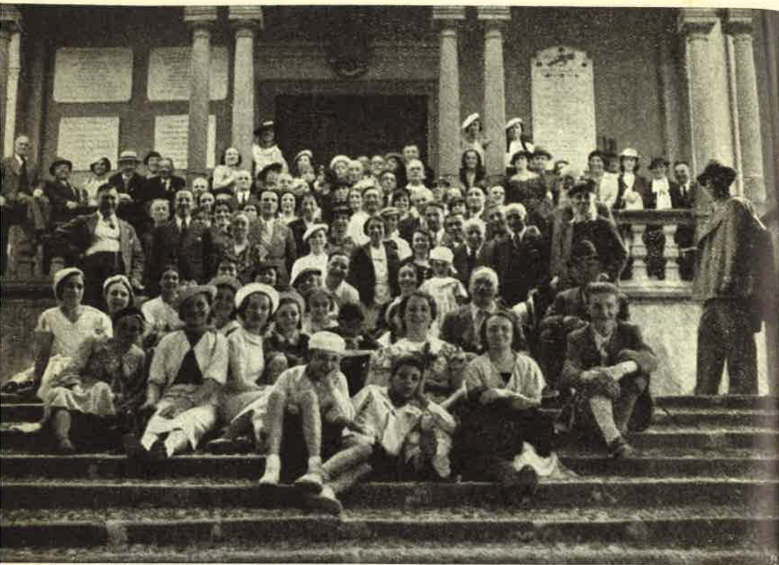
Pellegrinaggio della F. I. E. R. O. - Un gruppo.