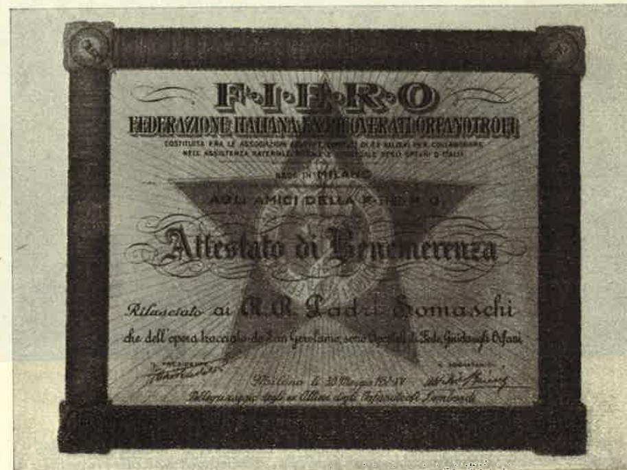
Diploma Aggregazione dei Padri Somaschi alla F. I. E. R. O.

L'anno centenario trasporta alla tomba gloriosa di S. Girolamo vere moltitudini di fedeli. Un'accorrenza tale è la prima nella storia del santuario. E le grazie non sono meno straordinarie. Segno evidente che le feste di quaggiù hanno sonora risonanza in cielo, che S. Girolamo è sempre il tenero padre e il pietoso soccorritore dei suoi devoti.