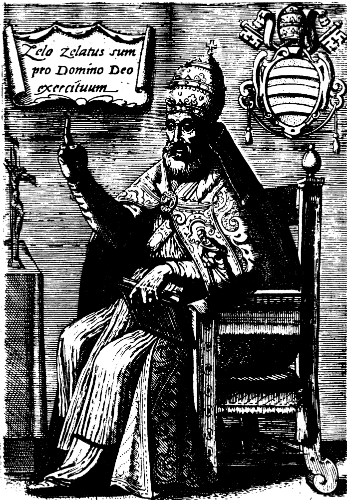
Paulus III. Pont. Max. gravissimus Christiana pietatis eiusq. sincerioris cultus assertor atq. restaurator, Card. Sirlet. ad Icon. Pauli.