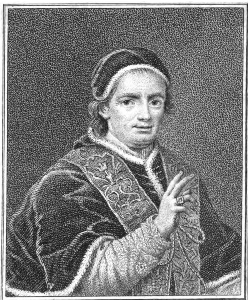
Inciso da Arrigo Mùsasi sopra quello di I.D.Porta.