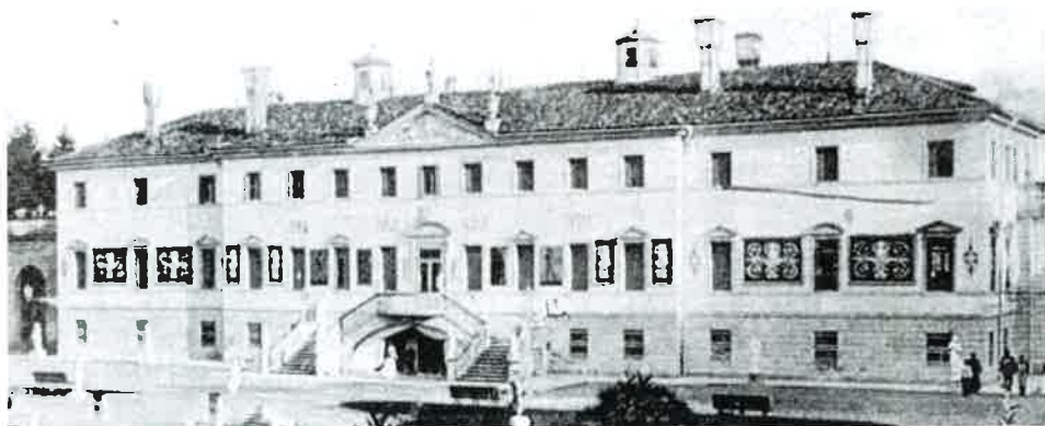
Villa Lichtenberg o Villa Margherita di Treviso (inizi '900)