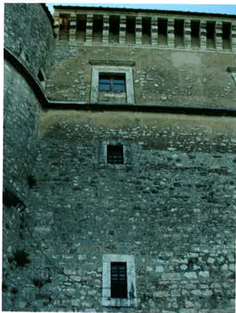
12. Castello di Alviano, particolare delle finestre.