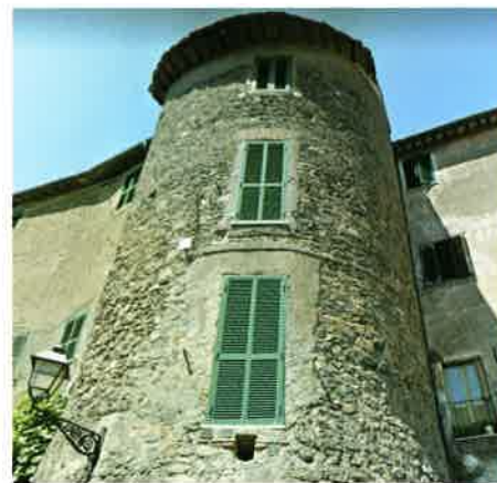
2. Bracciano, torre della Sentinella, 1490-96.