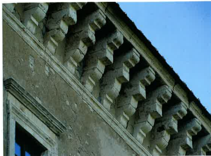
13. Castello di Alviano, particolare del coronamento con becatelli.