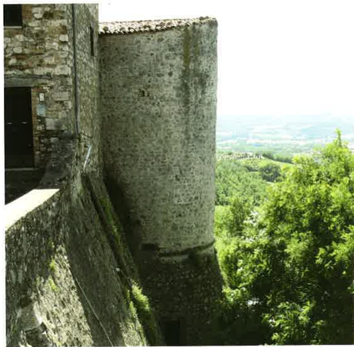
10. Alviano, particolare di una delle torri della cinta muraria esterna.