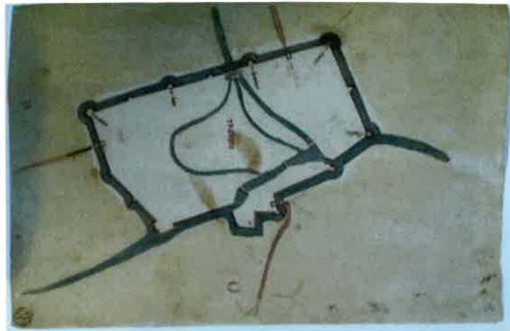
5. Pianta delle mura di Treviso , 1540-45 (Treviso, Biblioteca Comunale, ms. 1019, cc. 44-45, tav. 21b).