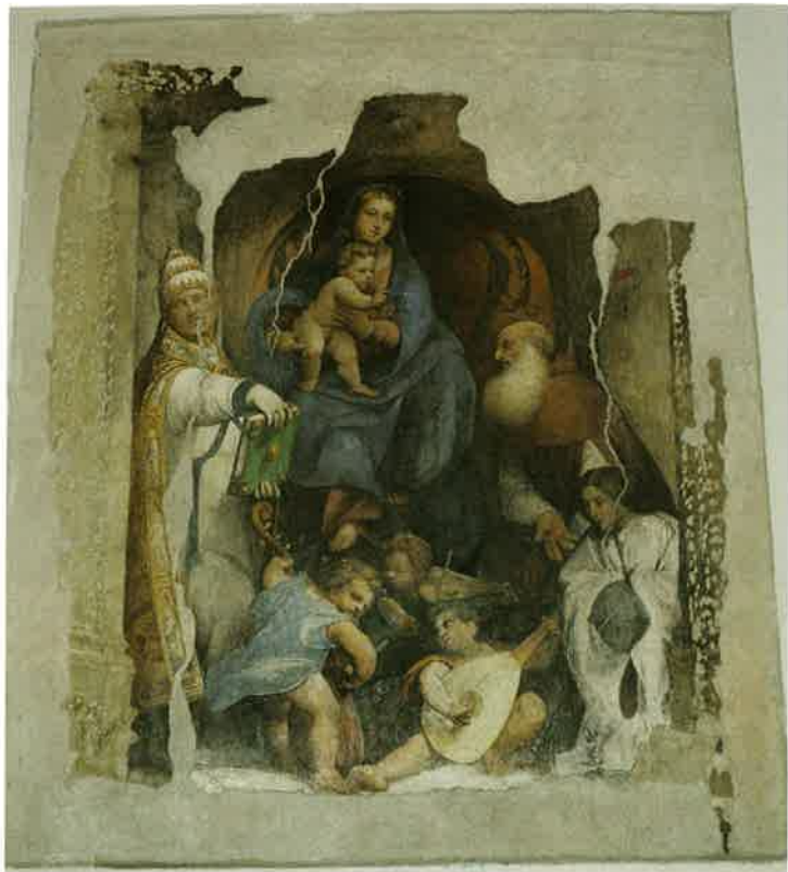
14. Giovanni Antonio de' Sacchis detto Il Pordenone, Madonna con Bambino tra san Silvestro e san Girolamo, una offerente (Pantasilea Baglioni?) e angeli , dipinto murale, chiesa parrocchiale di Alviano.

Buovo 12 . A Vicenza, poi, richiede la collaborazione del bombardiere Basilio della Scola, dunque di un tecnico militare specializzato 13 .