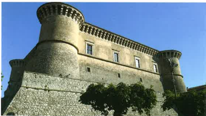
8. Castello di Alviano, stato attuale.