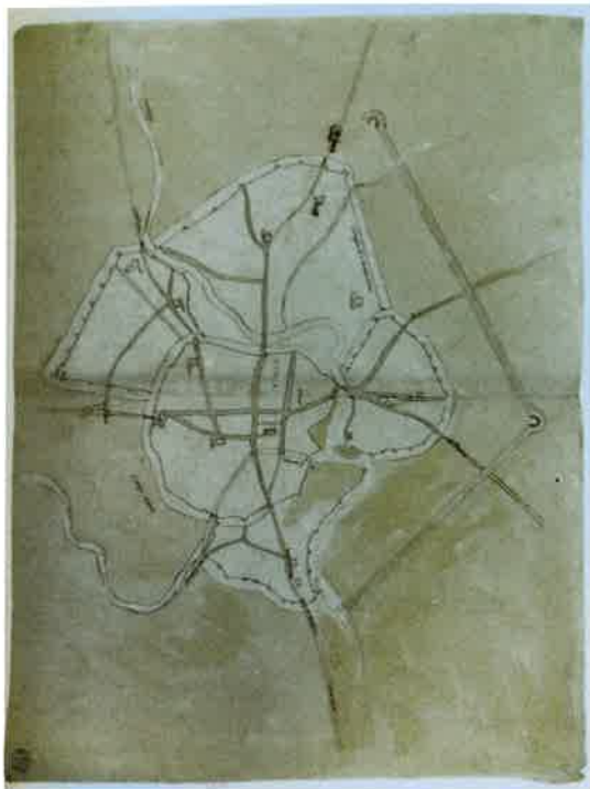
7. Pianta delle mura di Vicenza , 1540-45 (Treviso, Biblioteca Comunale, ms. 1019, cc. 32-33, tav. 15).