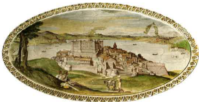
3. Taddeo e Federico Zuccari, Veduta di Bracciano , 1560-70 (Castello di Bracciano, sala delle Imprese).