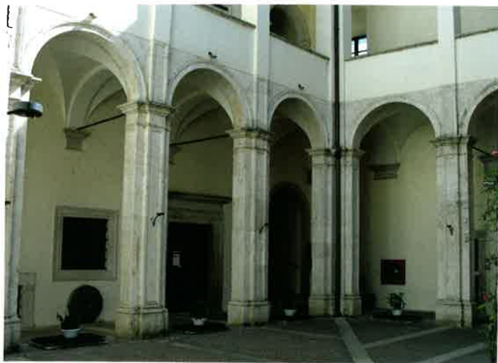
11. Castello di Alviano, cortile.