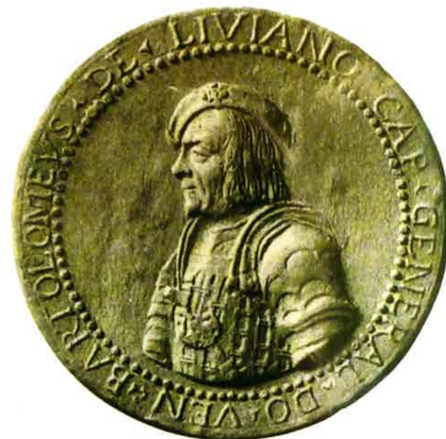
1. Medaglia raffigurante Bartolomeo d'Alviano (1515 circa). Il ritratto è contornato dalla scritta: Bartolomeus . de . Liviano . Cap . General . Do . Ven .