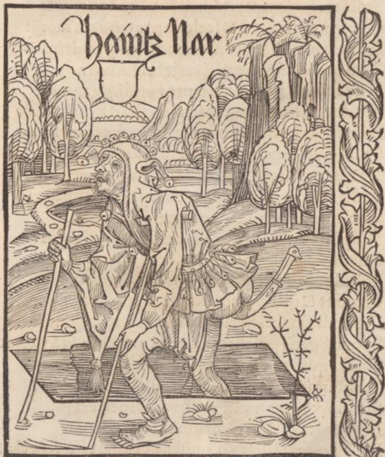
De antiquis fatuis.

Inueterata meę dementia crassa senectę: Non solitos linqvit mores: vitamve priorem: Sum puer: & centū transacti temporis annos Connumerare queo: nec enī sapientior vsq̄