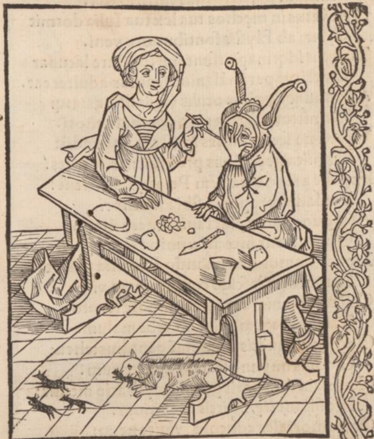
De adulte rio.

Est fatuus qui scit vigilantí stertere naso: Et faciem dygitis contegere vsq; suis. Vxoremq; suam subigí permittit: & audit Illecebras: ridet subdola catta iocos.