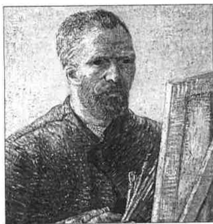
«Autoritratto come pittore» (1887-1888)

Un sito rinnovato, arricchito, dalla navigazione facile e intuitiva ha preso il posto della vecchia pagina web del Van Gogh Museum di Amsterdam; volendo, è possibile esplorare il mondo dell'artista anche partendo da un solo particolare — una data, o il luogo dove è stata realizzata un'opera — oppure ingrandire le immagini dei quadri in alta definizione fino a cogliere il dettaglio di ogni singola pennellata. Le immagini più interessanti, poi, possono essere facilmente postate e condivise sui social network. È in cantiere, inoltre, un nuovo allestimento della collezione che sarà inaugurato a novembre.