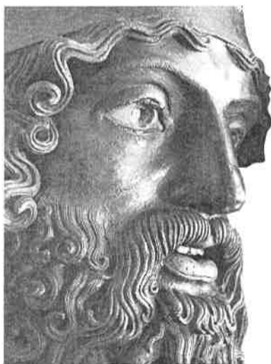
Particolare di uno dei Bronzi di Riace

co, antimonio, bronzo, ferro, argento, oro, mercurio, zinco. Nel volume, particolare attenzione viene dedicata al bronzo, metallo non esistente in natura ma ottenuto legando al rame un secondo metallo, spesso stagno o piombo, e per un certo periodo della protostoria anche arsenico o antimonio. «Se già la scoperta dei metalli aveva emancipato l'uomo