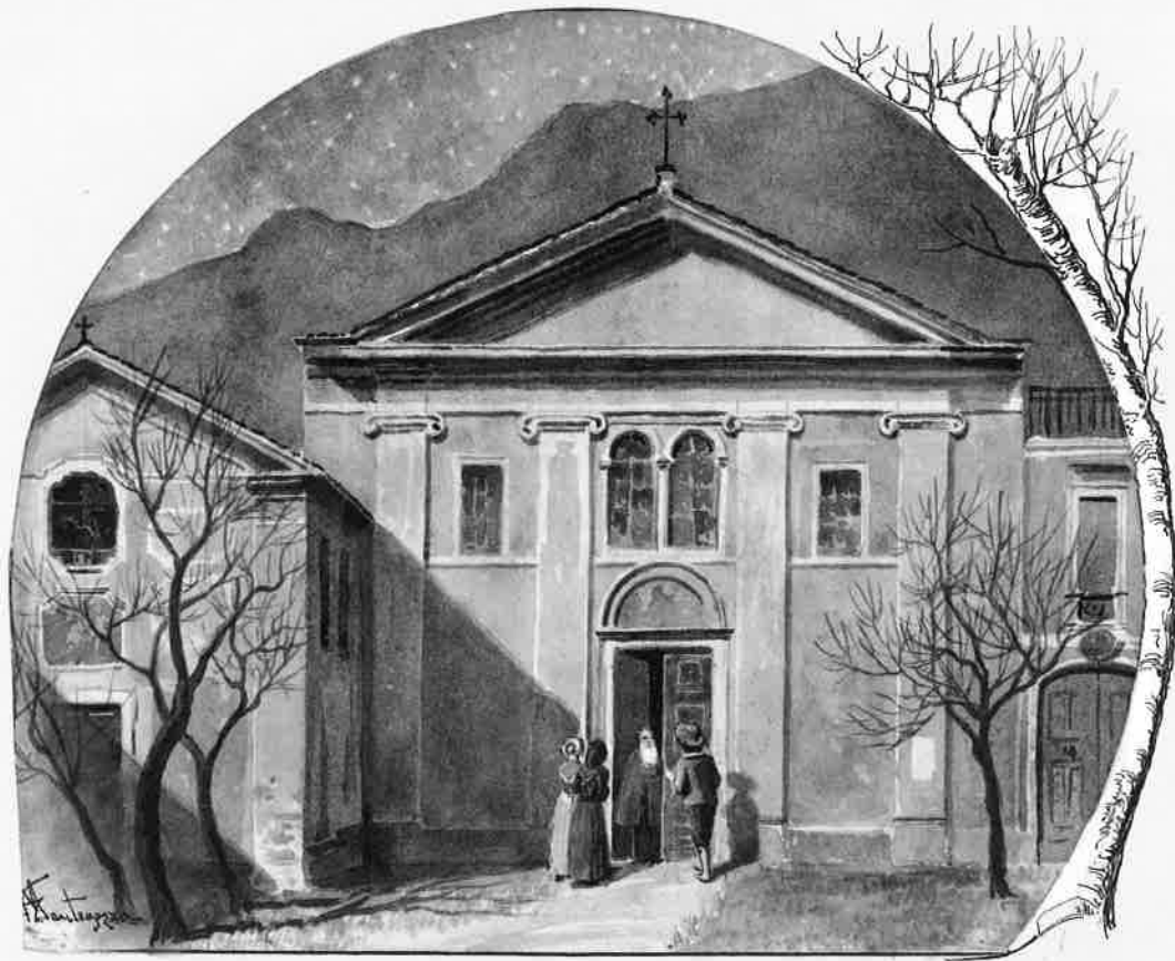
la luna, entrando per lo spiraglio, illuminò la faccia pallida, e la barba d'argento del padre Cristoforo. Cap. VIII