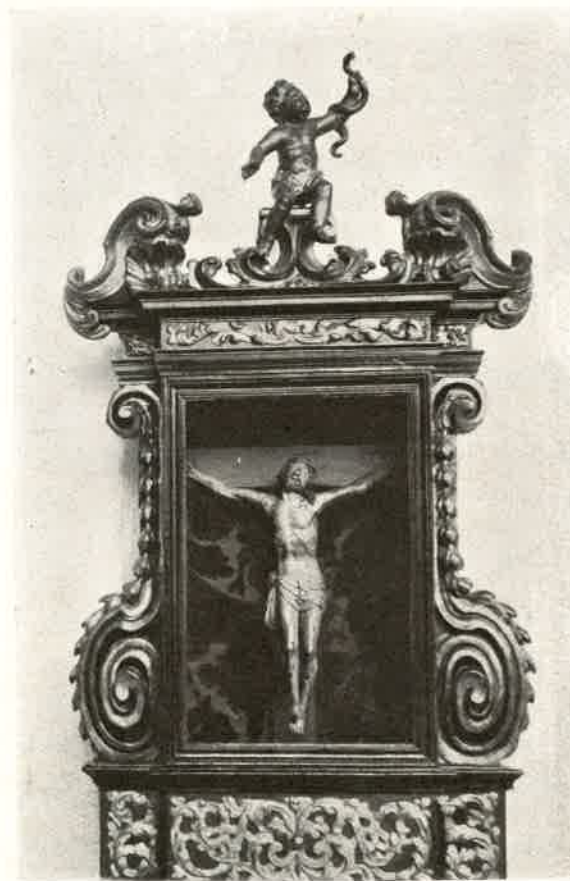
Monastero " Matris Domini „ Crocifisso Miracoloso.

Quando, qualche giorno più tardi, si pose a letto, assicurò tutti che presto avrebbe lasciata la terra. Si constatò infatti essere affetta da colera, che in pochi giorni la ridusse in fin di vita.