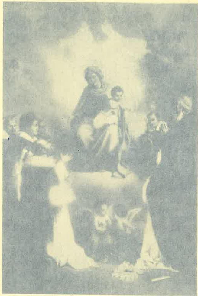
MADONNA DEL S. ROSARIO